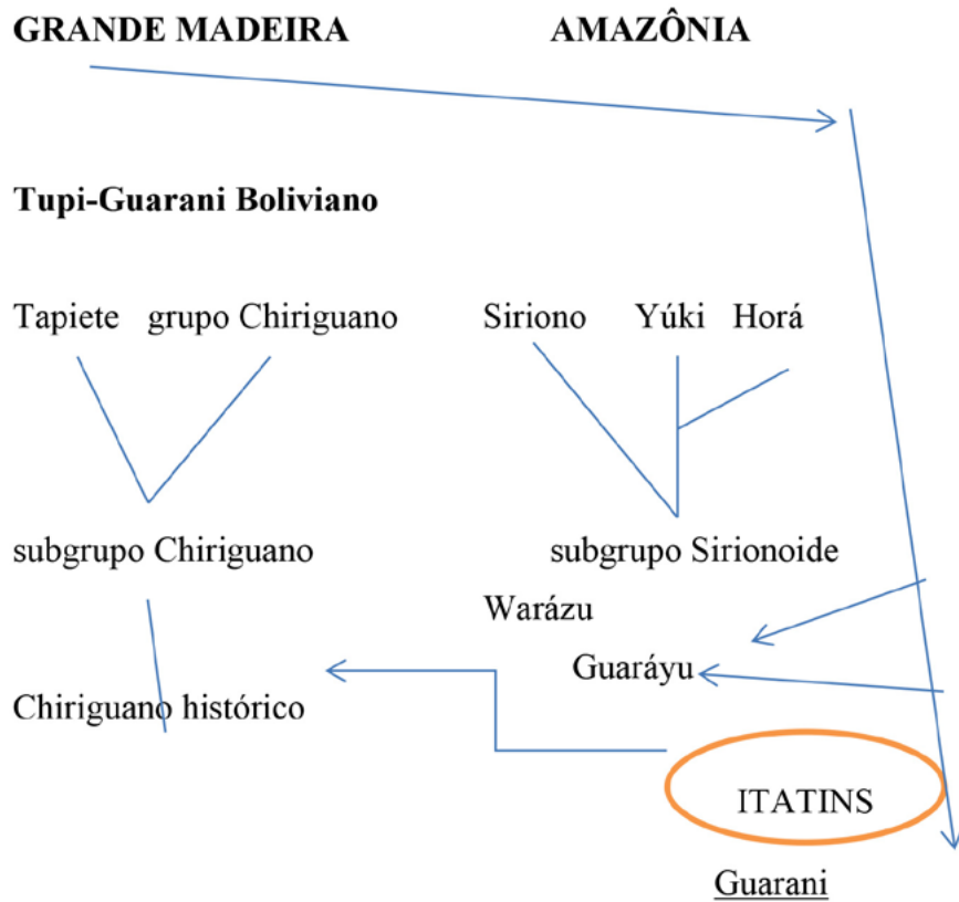
Tabela 1. Formação hipotética do TG boliviano