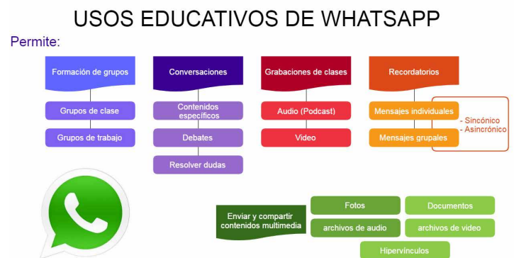
Figura 1: Usos educativos de WhatsApp

En el ámbito educativo, el uso de WhatsApp implica la necesidad de un conocimiento mutuo del entorno virtual para el intercambio de mensajes, producido en emisores y receptores y su red de contactos que se pueden apreciar en la figura 1 (Gómez Del Castillo, 2017). Para Suarez (2018), el uso educativo de WhatsApp se remite a la creación ocasional de un grupo, formado por los estudiantes y que pueden incluir al docente. En este sentido, cabe precisar las necesidades e intereses con fines educativos que emergen para la conformación de un grupo de conversación en WhatsApp entre estudiantes.