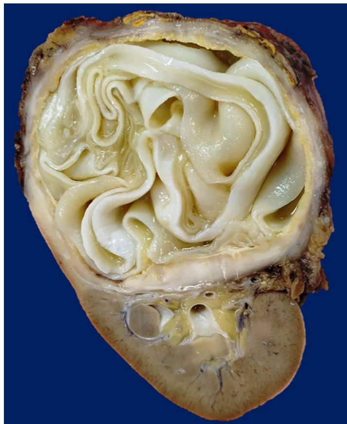
Figura 2. Corte macroscópico de quiste renal complejo.