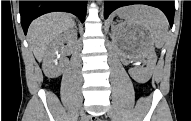
Figura 1. UROTEM: Quiste complejo en riñón izquierdo.

sugirió quiste simple complicado y hemorrágico en vías de resolución. No se identificaron lesiones quísticas pulmonares ni hepáticas (Figura 1). Con el diagnóstico presuntivo de tumor renal de etiología a