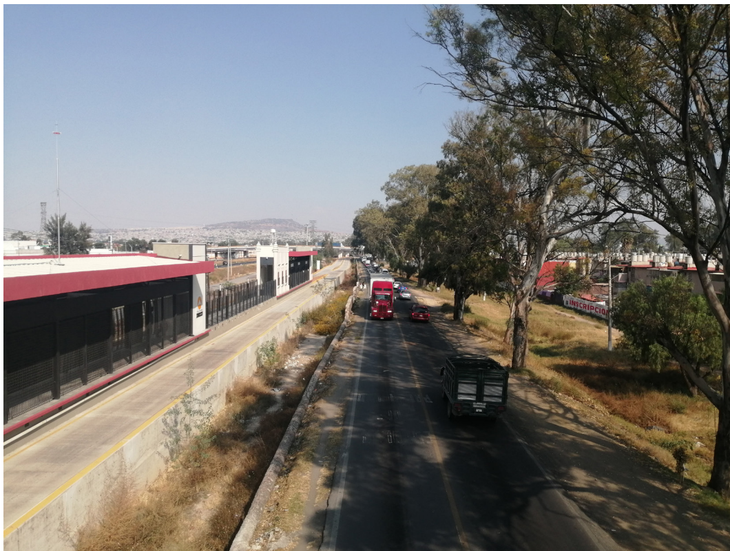
Imagen 6. A la orilla de la nueva estación