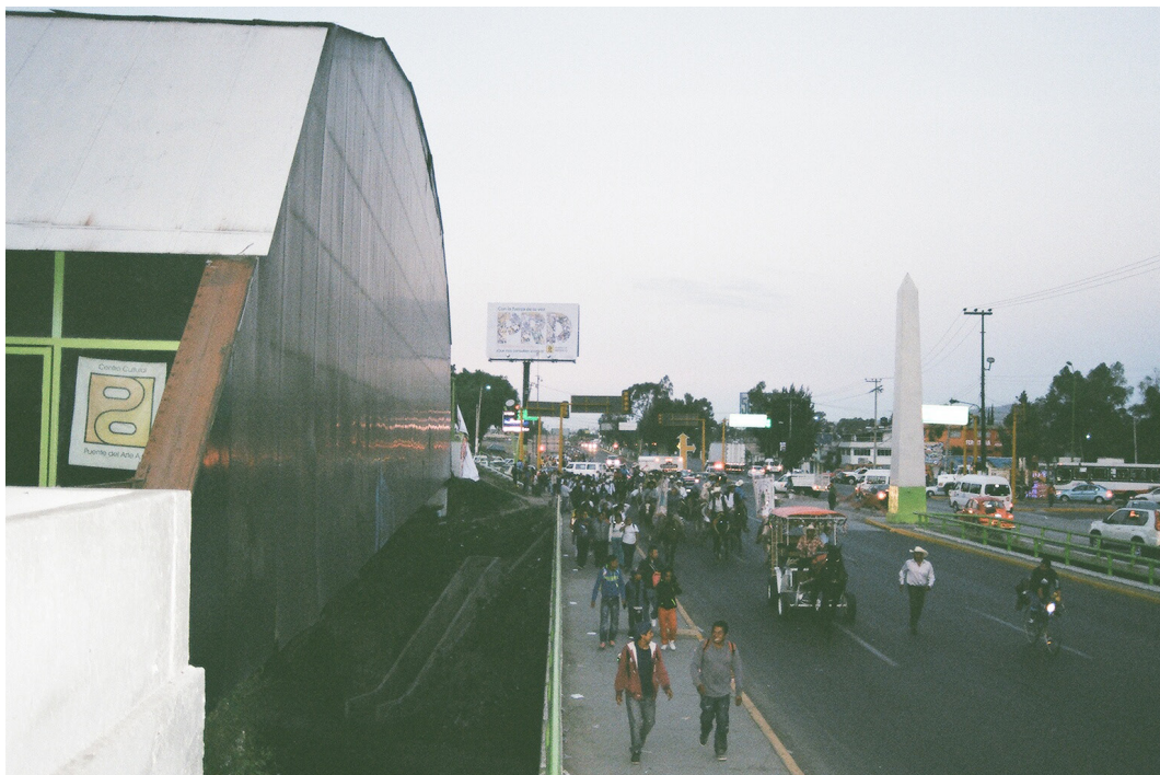
Imagen 11. Calandria, jinetes, peregrinos y puentes Fuente: Ismael Mejía Hernández, Ecatepec de Morelos, diciembre 2013