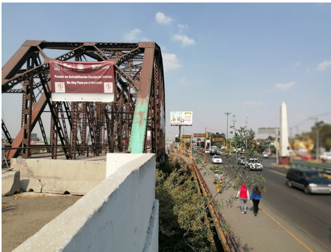
Imagen 12. Puente de fierro 2020 Fuente: Miquizcouatl Mejía Márquez, Ecatepec de Morelos, diciembre 2020