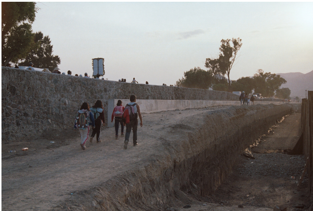
Imagen 3. Nueva fosa en el camino Fuente: Miquizcohuatl Mejía Márquez, Ecatepec de Morelos, diciembre 2017