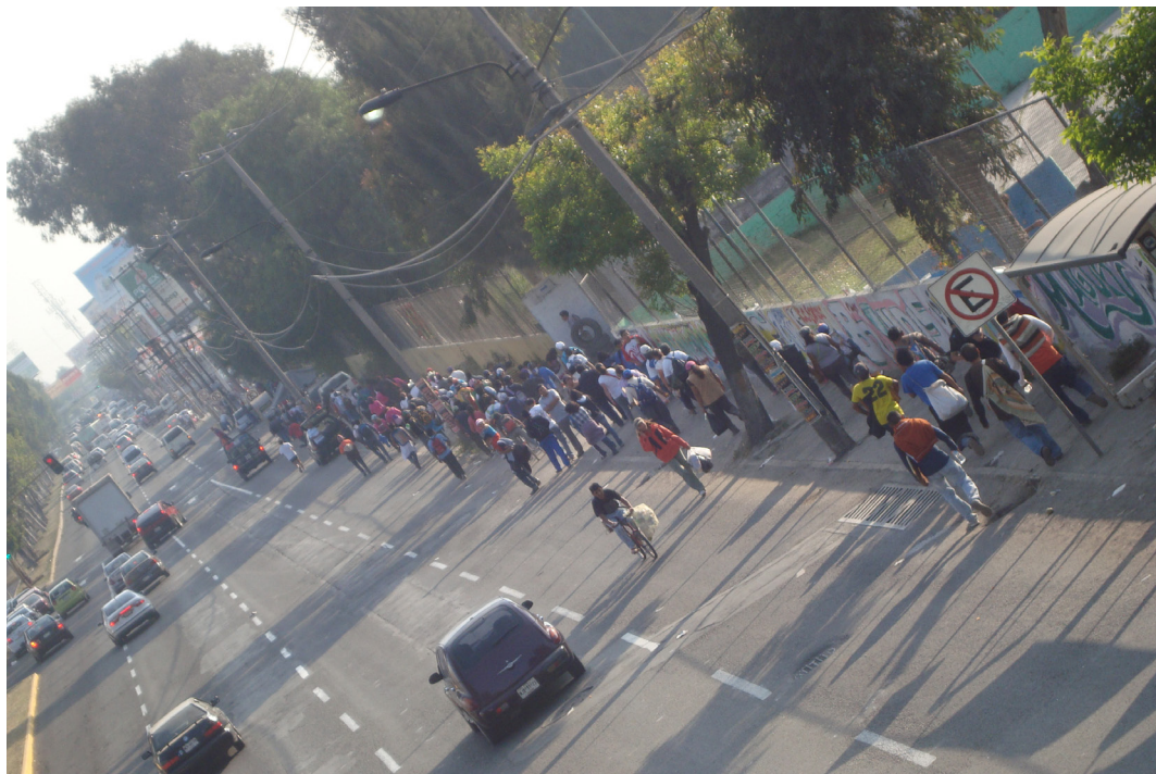
Imagen 13. Vía Morelos