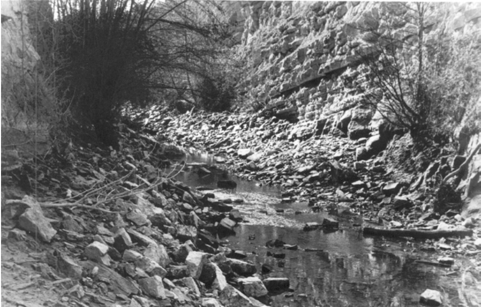
El Canal d'Urgell abans de revertir al país regant.

l'impost de la contribució mercès a la millora que experimentarien les terres de reg, fins arribar a cobrar, per una vegada, 150 ptes. per hectàrea.