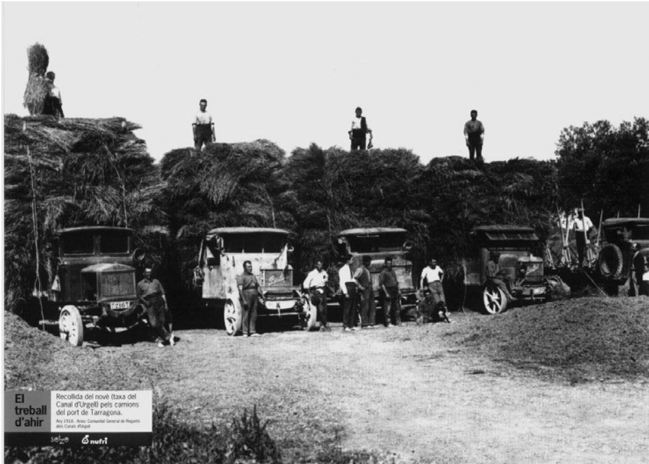
Recollida del novè pels camions del port de Tarragona. 1918

L'any 1919, els regants de Mollerussa ja havien demanat que s'arreglés, però corria l'any 1926 i encara no s'havia resolt el problema.