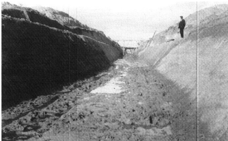
Estat del canal després d'un esclavissament de terra.

Protagonistes. Empresa S.A. Canal d'Urgell, Sindicat de Regants, Diputació Provincial, Junta Provincial d'Agricultura, Indústria i Comerç, Col·legi d'advocats, Cambra de Comerç de Lleida.