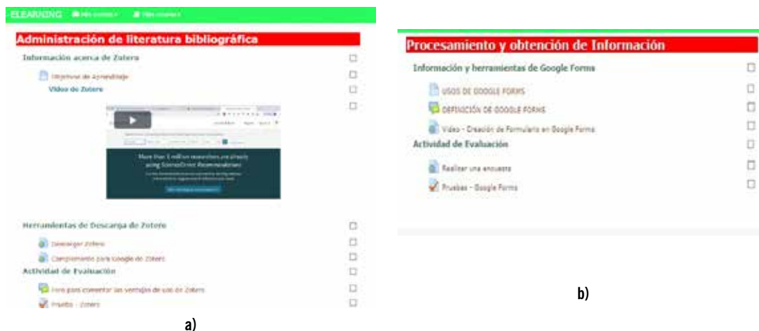
Figura. Estructura del aula virtual y aplicación de las estrategias de diseño instruccional.