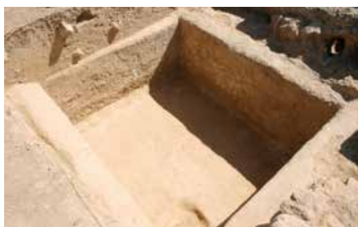
Figura 2. Lacus , sondeo 3.

Al igual que el otro depósito encontrado, tanto sus paredes como fondo están contruidos con mortero de cal, recubiertos con mortero hidráulico y con un bocel inferior que le proporciona la impermeabilidad necesaria. El mal estado de conservación ha hecho imposible definir su conexión con la estancia 2, ya que se han perdido los vestigios arqueológicos de la unión entre ambos. A pesar de ello, creemos que sí estuvieron unidos a través de un canal en su momento de construcción ya que conserva la misma disposición que la unión entre las estancias 1 y 3 en el lado opuesto del torcularium .