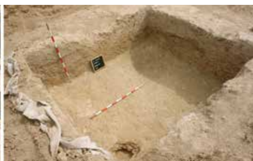
Figura 3. Lacus , sondeo 4.