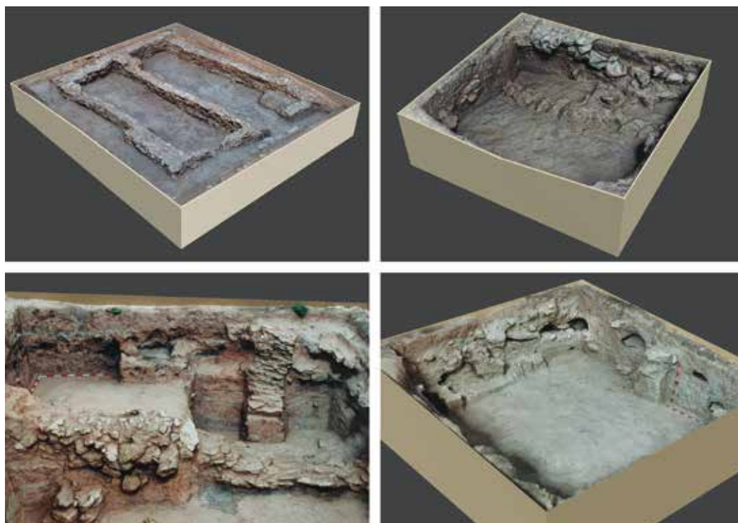
Figura 2. Fotogrametrías de las zanjas intervenidas.

En 2018, se comenzó a intervenir en las zanjas adyacentes a las estructuras restauradas (7, 8, 9, 12, 17, 13-14-18-19), que habían quedado sin colmatar tras su excavación, trabajo que se ha continuado en las campañas de 2019 y 2020. El planteamiento para la intervención en todas las zanjas del yacimiento es el mismo, en primer lugar, se retiran los derrumbes que se han ocasionado durante los años de abandono, para poder reavivar los perfiles y reinterpretar la estratigrafía encontrada. Posteriormente se procederá a colmatarlas con el fin de ralentizar el deterioro de las mismas. Además, se están realizando levantamientos fotogramétricos de cada una de las catas con el fin de no solo obtener una documentación gráfica lo más precisa posible de las estructuras, sino para también poder musealizar digitalmente estas zonas. Por otro lado, las intervenciones en estas zanjas están ofreciendo numerosos datos inéditos, pudiéndose detectar varios niveles de suelo, muros de adobe revestido y evidencias de pintura mural.