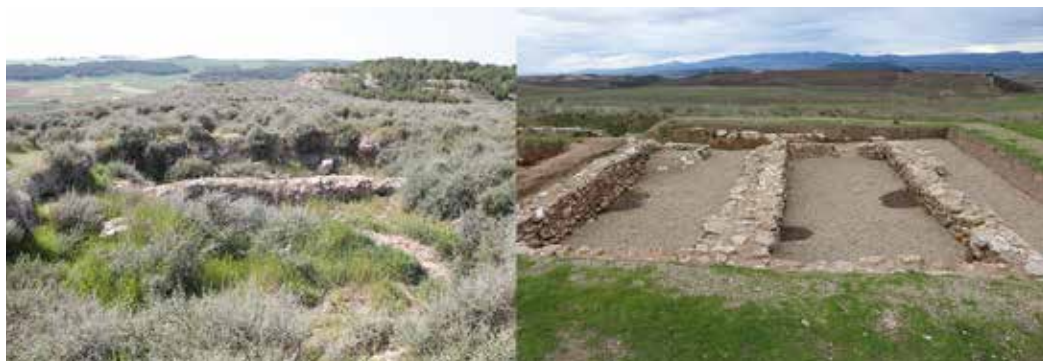
Figura 1. Estado en el que se encontraba el yacimiento antes de comenzar la intervención de 2017 y estado en el que se encuentra tras la intervención.