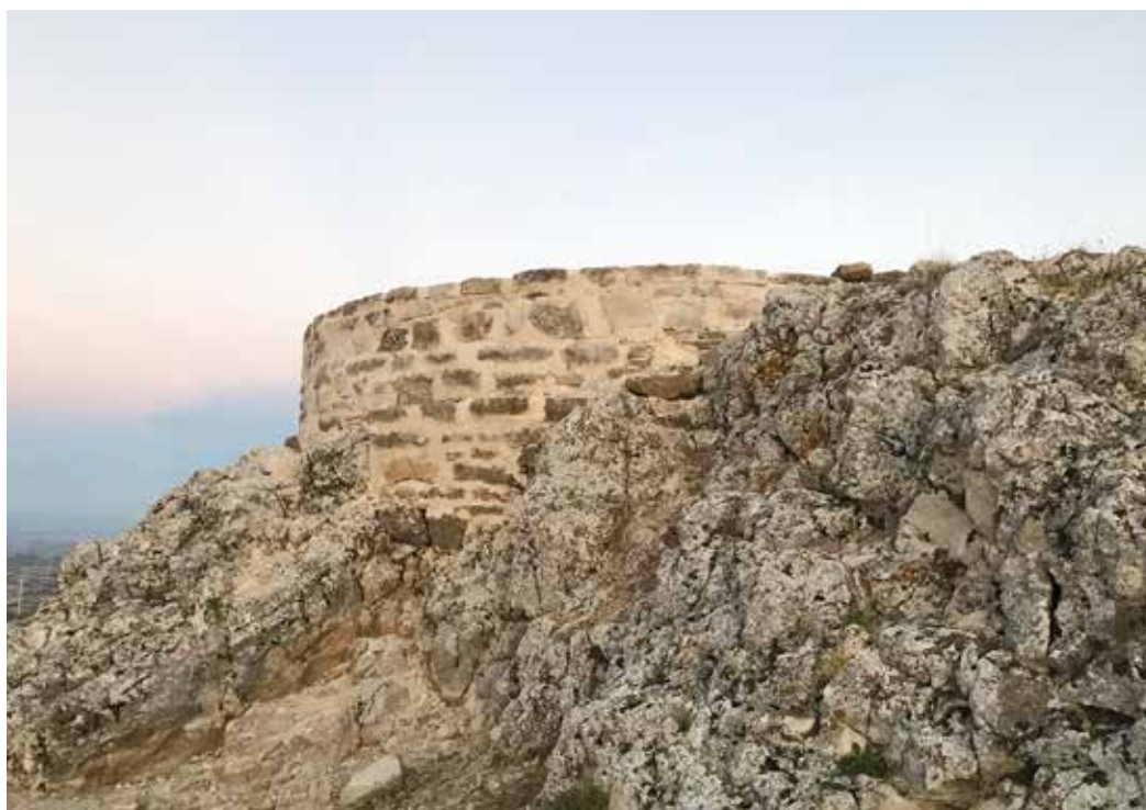
Figura 6. Vista de la torre desde la parte este del castillo.

La torre se ha creado con una altura de 110 cm, incluyendo 40 cm de zapata. El diámetro de la torre es de 300 cm, y el grosor de los muros 150 cm.