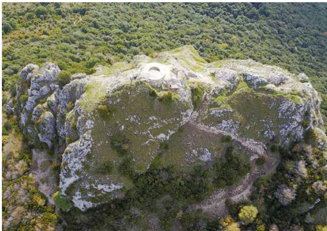
Figura 1. Fotografía aérea de la cima de la peña Unzué, con la torre del homenaje en su parte central.