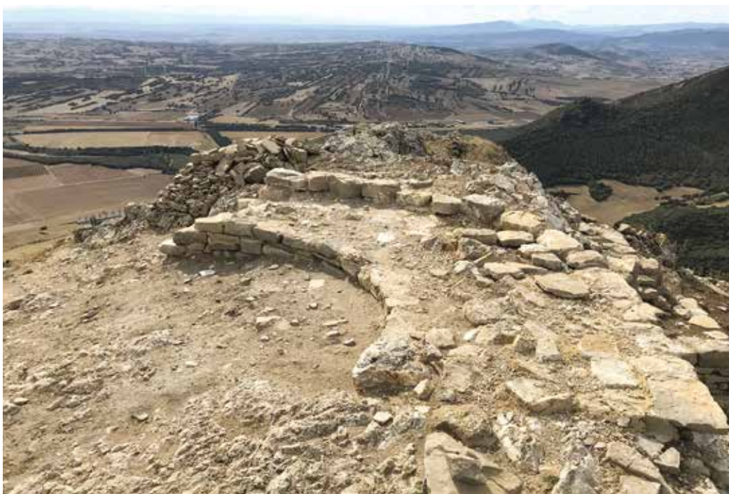
Figura 3. Restos de la torre del homenaje antes de su consolidación.