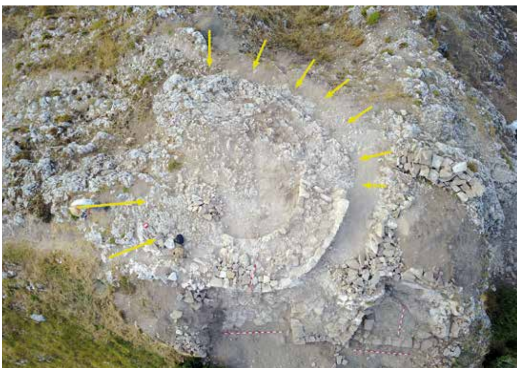
Figura 4. Impronta en la roca que nos muestra la trayectoria del muro de la torre del homenaje.