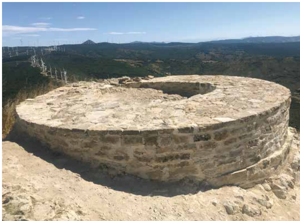
Figura 5. Torre del homenaje consolidada.

De esta forma, los trabajos comenzaron realizando varios equipos. Unos subían piedras, otros realizaban trabajos relacionados con la mezcla de arena, cal y agua para realizar la argamasa y otros realizaban la reconstrucción.