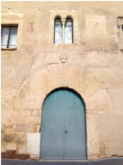
Façana del Castell de Masricart.