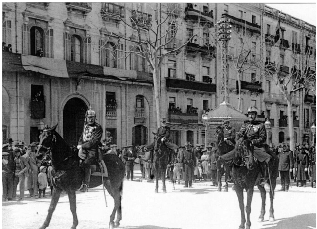
Façana casa Feliu de Tarragona