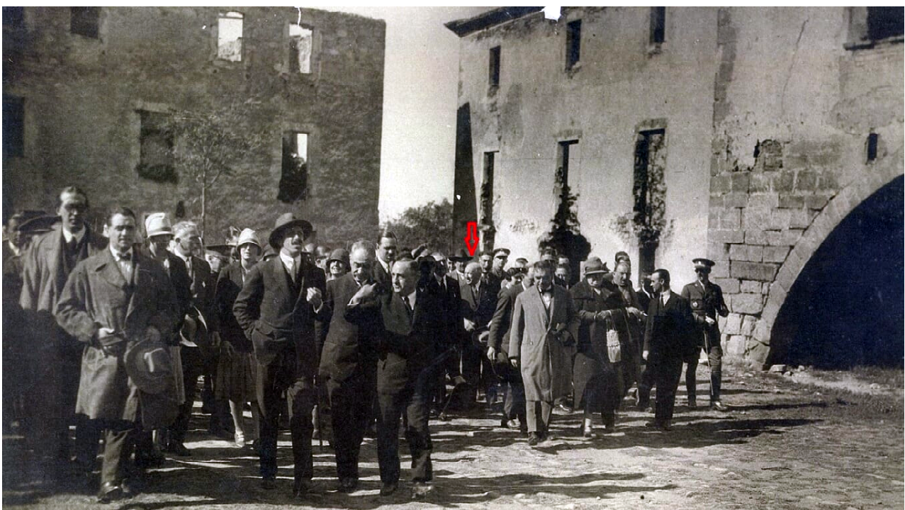
Fotografia del rei Alfons XIII i assenyalat amb color vermell Manuel de Castellví i Feliu, data i lloc desconeguts