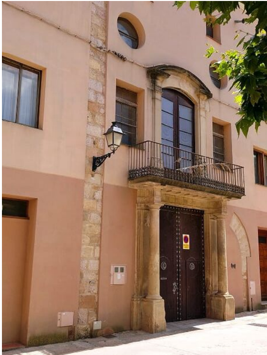
Façana de la casa Castellví de Montblanc.

una peça de terra erma a la partida de l'Amalguer. Les propietats de Tarragona eren la casa del carrer de la Destral amb el seu hort, un forn per coure pa i un hortet tancat a la partida del Port. També hi havia alguns censals de particulars i de les Universitats de Cambrils i Barcelona, amb endarreriments de pensions i altres deutes a favor de la casa de Castellví. També diverses peces i joies fora de la casa de Castellví deixades a particulars.