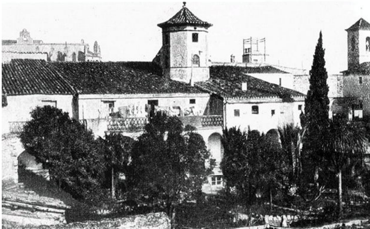
Postal de la casa Castellví de Montblanc, vista del pati.