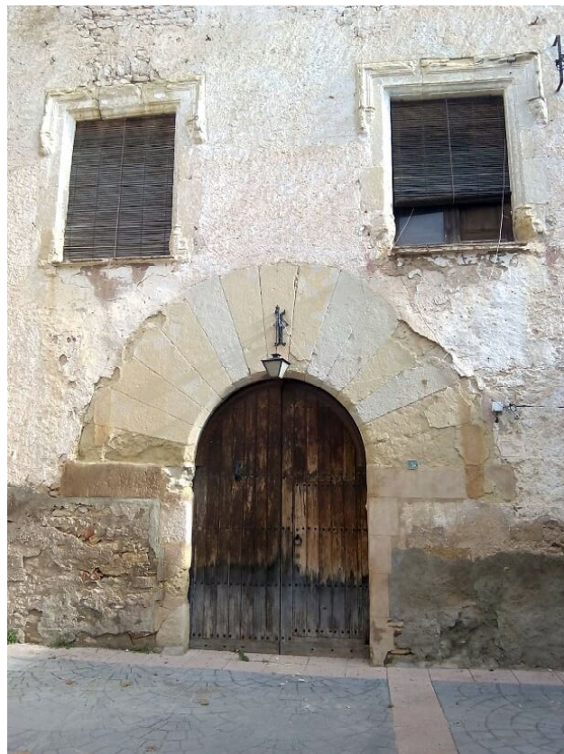
Façana casa Castellví de Vilabella. Antiga casa Pontarró. 2020.