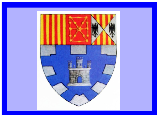
Escut de la família Castellví.

el molí i la vinya de la plana d'Anguera. La resta de patrimoni que arriba fins els nostres dies serà el que bastirà la família de Castellví generació rera generació.