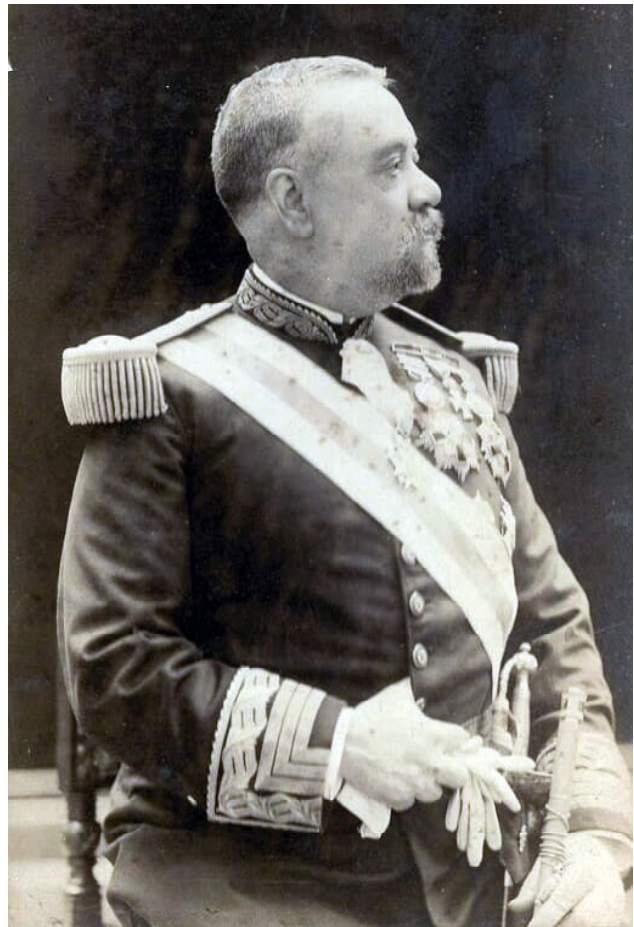
Fotografia del general Luís M. de Castellví i de Vilallonga

El general de Castellví, morí a Barcelona el 24 de setembre de 1918.