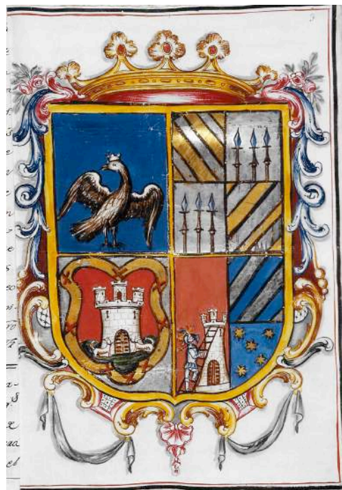
Fig. 6. Armas de Frey Pascual Mateo y Lozano, Fernández de Felices y Monoy de Ibdes.