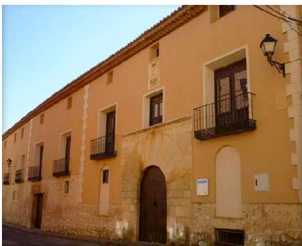
Fig. 1. Casa de los Mateo de Gilbert, calle Costera Olma, Monreal del Campo.

La rama más estudiada del linaje, la de Monreal del Campo, se estableció en esta población en el siglo XVII al entroncar, mediante matrimonio, Miguel Mateo y Martínez Rubio (Odón, 15-IX-1563) con Rafaela Vázquez de Molina (†8-IV-1630), rica heredera residente en esta localidad, siendo el nieto de este matrimonio Juan Jerónimo Mateo y Cabello (Odón, 17-VI-1627), el que fijó su residencia definitivamente en Monreal, donde testó el 27-II-1681. Desde entonces permanecieron en el valle del Jiloca. Fueron una de las familias más influyentes de Monreal, donde todavía se conservan dos de sus palacios. Una de las ramas de los Mateo de Gilbert enlazó en 1799 con la familia Catalán de Ocón, uniendo así en una misma familia dos de los más importantes patrimonios que existían en Monreal. A ella perteneció Miguel Mateo de Gilbert (Monreal del Campo, 1792), héroe de la Guerra de la Independencia y caballero laureado de San Fernando 8 . La descendencia de Miguel Mateo y Martínez Rubio obtuvo confirmación del privilegio por la Real Audiencia de Aragón en 1742, 1752, 1794 y 1815 9 .