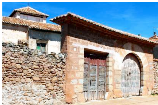
Fig. 24. Detalle de la entrada.