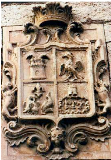
Fig. 8. Escudo de los Fuertes, Santa Eulalia del Campo. 1. Fuertes, 2. Mateo, 3. Gómez de Liria y 4. Gilbert y Esplugas.