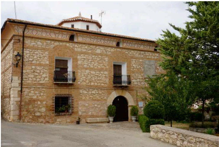
Fig. 17. Casa Grande o de los Lario, Cosa.

III f 2 a. Antón Blas de Castro y Anel (†Barrachina, 12-XII-1641, sepultado en la iglesia), jurado de Barrachina en 1605 74 y jurado mayor en 1612 y 1617, casó con Juana Lario de Esplugas (†Barrachina, 11-V-1647, enterrada en la iglesia), natural de Cosa, hija de Miguel Lario, que obtuvo salva de su infanzonía en 1576, y de María de Esplugas, con la que había casado en Martín del Río, el 9-V-1554 75 .