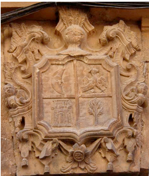
Fig. 5. Detalle del escudo.