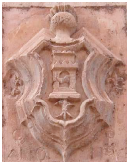
Fig. 19. Escudo de los Gonzalo de Liria, Burbáguena.