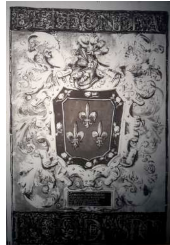
Fig. 18. Escudo de los Esplugas en la Ejecutoria que se conservaba en la casa de los Lario.