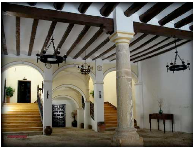
Fig. 4. Interior de la casa.