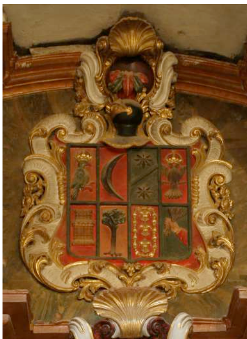
Fig. 10. Escudo de los Mateo en la parroquial de Luco. En los cuarteles 7 y 8, armas de los Esplugas y Sebastián.