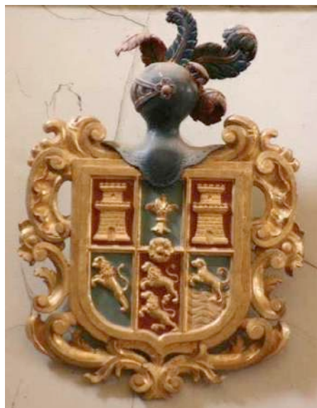
Fig. 15. Estudio de los Latorre, Parroquia Burbaguena