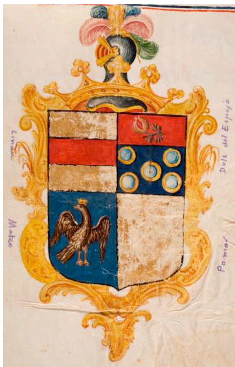
Fig. 12. Armas de Sor Josefa de Liñán y Dolz de Espejo, Mateo y Pomar.