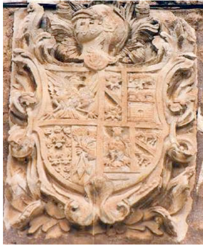
Fig. 16. Escudo de los Mateo y alianzas. Valdeconejos. 1. Mateo, 4. Esplugas, 5. Sebastián, 7. Ximeno o Baylo.

I. Pascual Mateo y Gilbert, natural de Torralba de los Sisones, pasó a Palomar de Arroyos. Fue padre de: