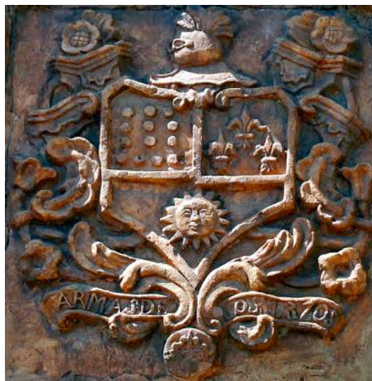
Fig. 22. Detalle del escudo.

IV a. Juan Mateo y Marzo, estudiante en 1583 114 .