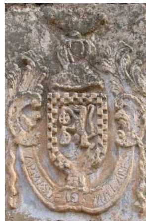
Fig. 26. Escudo de los Millán, Monforte.