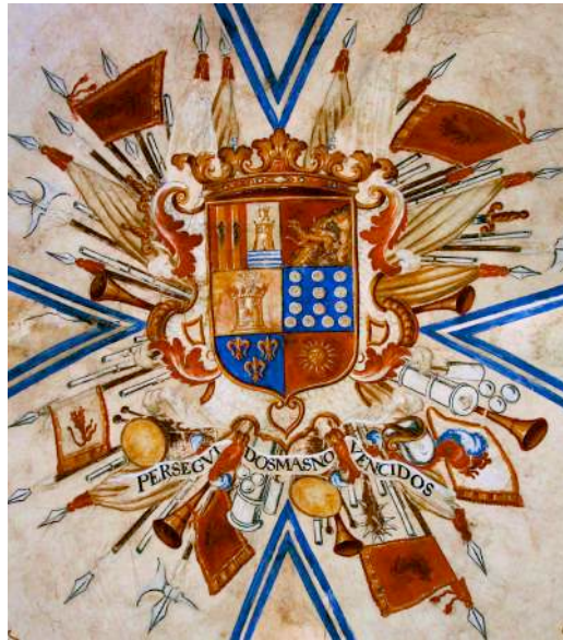
Fig. 25. Escudo de los marqueses de la Cañada, Orrios. 1. Ibáñez, 2. Cuevas, 3. Bernabé, 4, 5 y 6. Marzo.