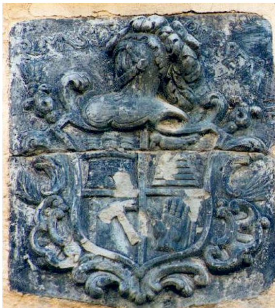
Fig. 20. Armas de los Oseñalde, Daroca.