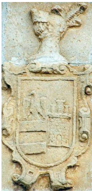
Fig. 14. Escudo de los Mateo en Odón.