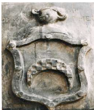
Fig. 28. Escudo de los Mateo, Montalbán.