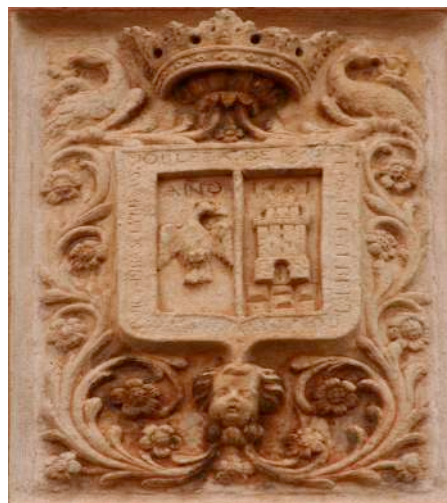
Fig. 2. Detalle del escudo.