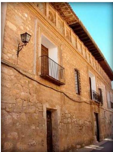
Fig. 3. Casa de los Mateo de la Plaza, Monreal del Campo.

único linaje, independientemente de otros vínculos de parentesco por los matrimonios con los Lario o los Esplugas. 15 De Ojos Negros una rama pasó a Monreal del Campo, fundando la casa Mateo de la Plaza, a la que perteneció Frey Pascual Mateo y Lozano, Fernández de Felices y Monoy de Ibdes, caballero de la Orden de San Juan.