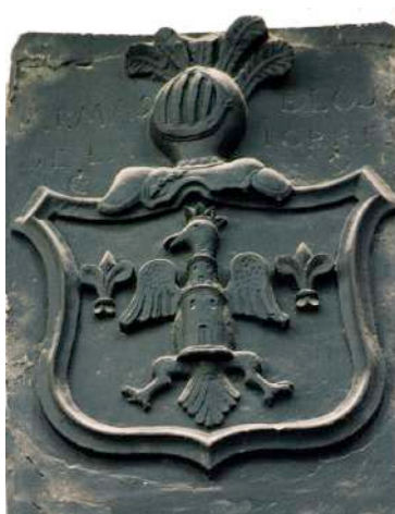
Fig. 27. Escudo de los Latorre, Montalbán.