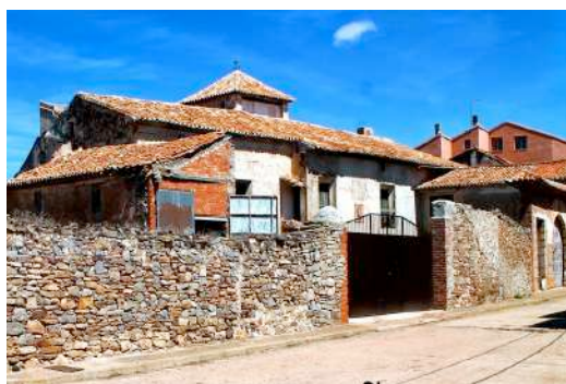
Fig. 23. Casa de los Ibáñez, marqueses de la Cañada, Lidón.