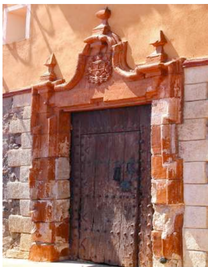
Fig. 21. Puerta principal de la casa de los Marzo, Lidón.