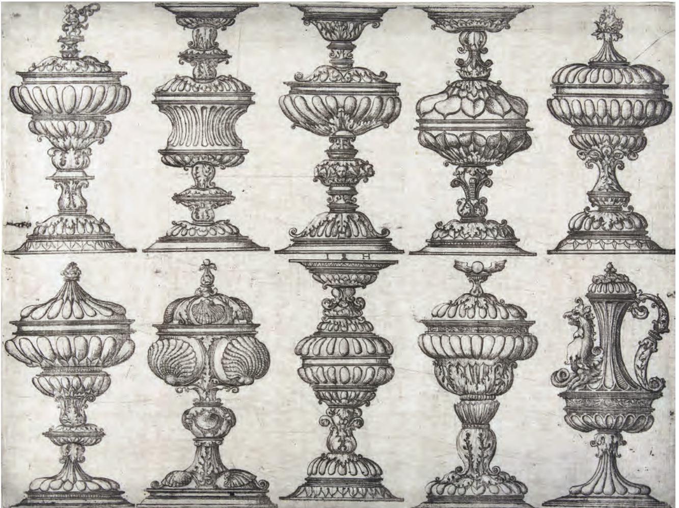
4. GRABADO CON COPAS GERMANAS DE ALBRECHT ALTDORFER Y HIERONYMUS HOPFER (1528-1550) . .