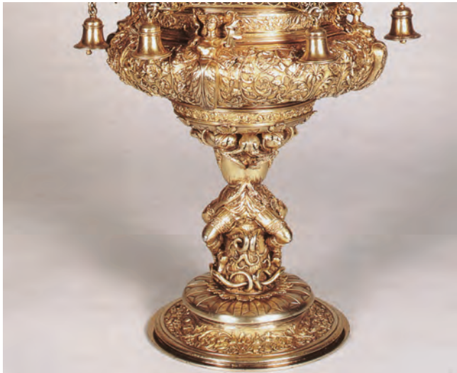
3. PIE DEL OSTENSORIO DE LA IGLESIA DEL SANTO SEPULCRO DE OSUNA. MUSEO DE LA COLEGIATA DE OSUNA. SOPORTE GERMANO DE STEPHAN KIPPENBERGER DE HACIA 1540.

efecto, tanto en el inventario de 1559 como en el realizado en 1586 se describe la pieza de igual manera: