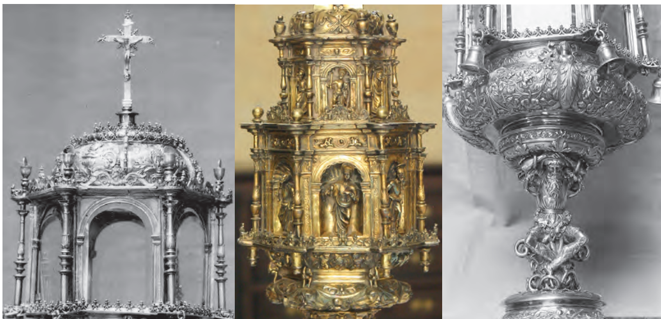
6A (DCHA.): TEMPLETE DEL OSTENSORIO DE LA IGLESIA DEL SANTO SEPULCRO DE OSUNA. MUSEO DE LA COLEGIATA DE OSUNA. POSIBLE OBRA SEVILLANA DE HACIA 1550 DE BALLESTEROS EL VIEJO.