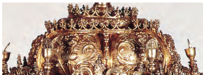
7. DETALLE DE LA CUBIERTA DEL TEMPLETE DEL OSTENSORIO DE LA IGLESIA DEL SANTO SEPULCRO DE OSUNA. MUSEO DE LA COLEGIATA DE OSUNA. POSIBLE OBRA DE BALLESTEROS EL VIEJO, DE HACIA 1550.

a una ancha copa entre roleos, que ocupan los seis tramos del cuerpo principal de la cubierta divididos con alargados tallos de tornapuntas, y los redondeados gallones que cubren el casquete del remate (fig. 7). Ciertamente es que todo este vocabulario ornamental no puede excluirse taxativamente de las creaciones germanas, si no fuera en este caso concreto por el diferente tratamiento técnico que apreciamos en su ejecución con respecto al comentado de la base y vástago del ostensorio. Precisamente, en estas ornamentaciones cinceladas de la cubierta vemos un dibujo mucho menos preciosista y de peor calidad en su acabado, con una diferencia técnica al recurrir al fondo picado para marcar el contraste con la figuración revelada. Igual sucede con las pequeñas copitas con la ostia superior, cuyo modelo y torneado recuerdan más a las creaciones hispanas que a las alemanas.