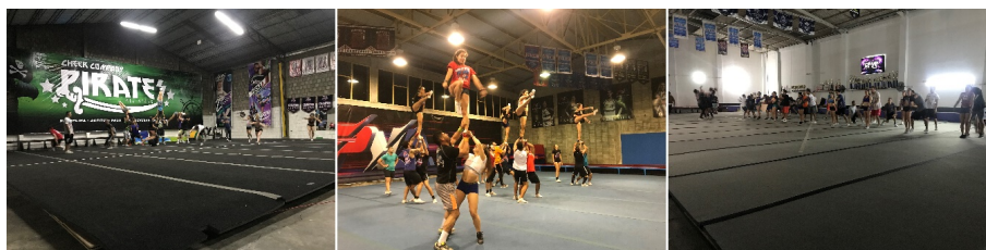
FIGURA 1 Representación de los centros de entrenamiento de porrismo.