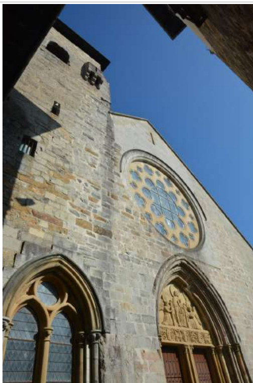
Entrada a la iglesia (siglo XIII).

consentimiento de su obispo de Pamplona, concederá a Roncesvalles un potente conjunto de tierras y bienes que se constituye como verdadera dotación fundacional: por una parte, las cuartas episcopales de las iglesias de los valles de Aézcoa y, desde Huarte al propio Roncesvalles, las de los valles de Erro y Esteribar. Y por otra, un elenco de heredades e iglesias en diversos valles cercanos a Pamplona. Sin ser especialmente cuantiosa desde el punto de vista económico, se extendía sobre un espacio muy considerable que actuó de potente catalizador del prestigio de la colegiata. En la segunda mitad de ese mismo siglo las posesiones crecieron de manera exponencial, y con ello el peso de Roncesvalles en la corte regia.