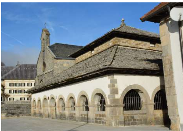
Primera posible iglesia del Sancti Spiritus.

Primera cuestión: la dinastía aragonesa que ahora se ciñe al espacio oriental había desarrollado una intensa política de desarrollo urbano del reino, con las primeras concesiones de estatutos