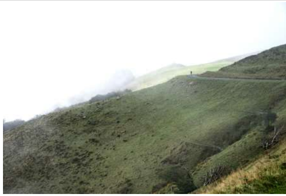
Paso de las cumbres.

ción antigua rodea el territorio desde el condado de Labourd y el vizcondado de Bearn: Bayona, Dax, Aire, Lescar y Oloron, pero la mayoría son sedes intensamente disminuidas, salvo quizá Bayona. La ruta de Lescar-Oloron, en el Bearn, se encaminaba decididamente a Somport y su hospital de Santa Cristina,