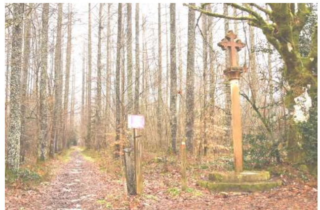
Actual Cruz Blanca o de Roldán.

La convivencia no siempre fue fácil, y las dos comunidades con el tiempo delimitaron sus territorios. De esta manera, siendo una de las razones, aparece en la historia un cruce de límite situado en el antiguo camino que los unía y hoy actual Camino de Santiago, conocido como la Cruz Blanca o de Roldán. El cruce marcaba el límite hasta donde se podían desplazar los canónigos por el sur y en todas las actas de reconocimiento de mugas de las dos localidades consta como lugar de origen de los reconocimientos, señalando el lugar como el primer mojón.