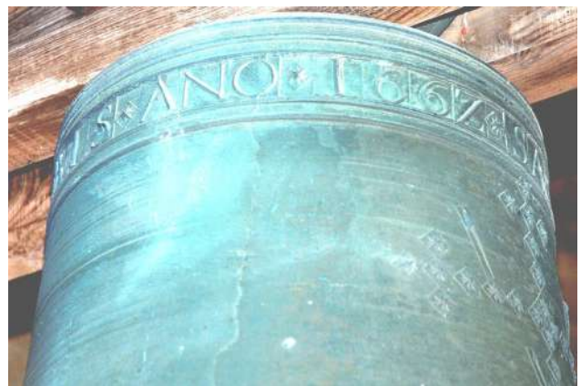
Campana antigua de San Salvador de Ibañeta, datada en 1662. Hoy en la iglesia de Auritz Burguete. Detalle

“En atención al fervoroso proceder del I. Cabildo de Roncesvalles al otorgar a esta villa en tan favorables condiciones la cesión de las aguas traídas este año propone a la consideración del Ayuntamiento se consignare en acta un solemne voto de gratitud para aquella I. Corporación testimoniando el profundo reconocimiento de la villa”.