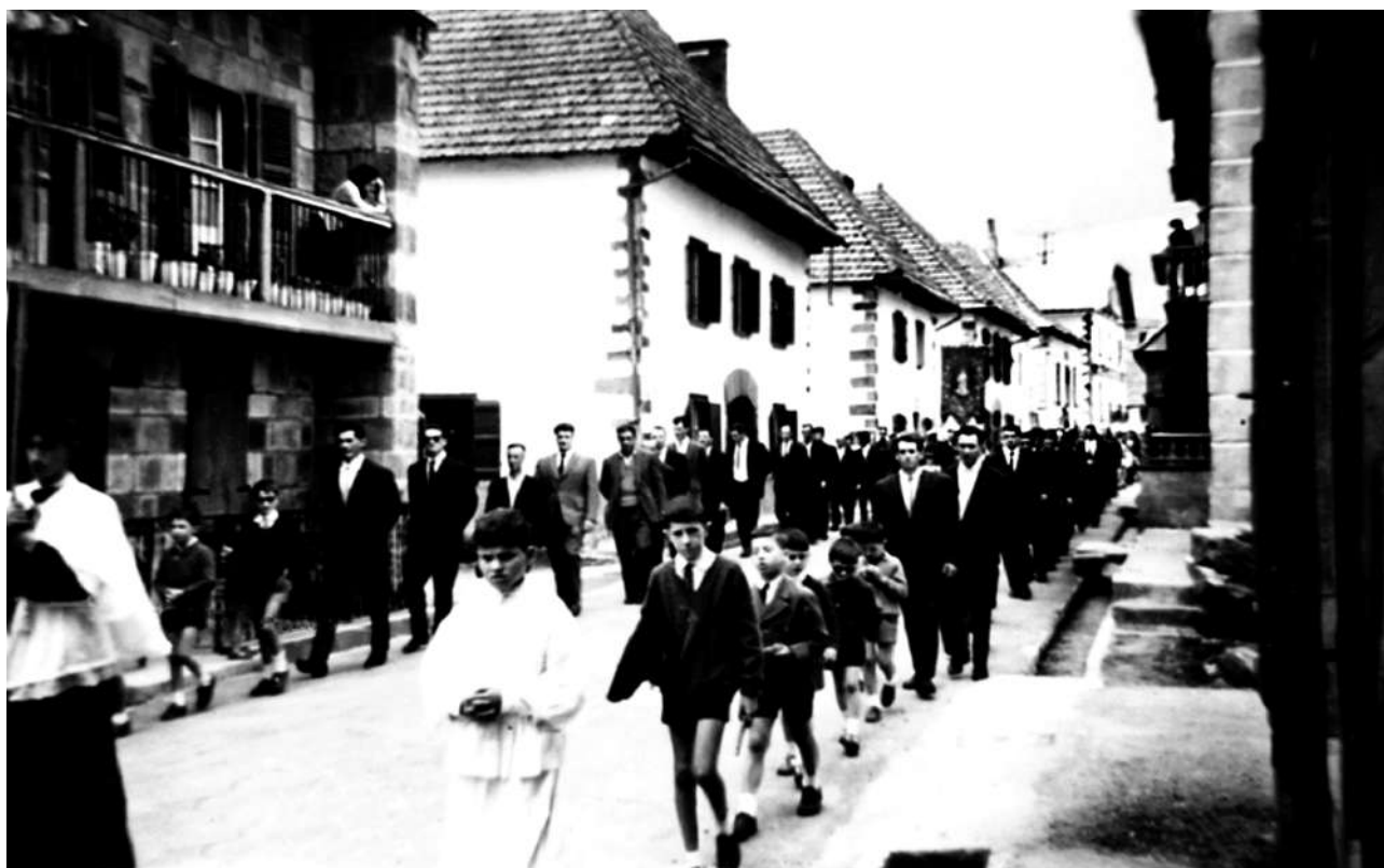
Procesión a Roncesvalles, 1966.

Lo quinto, que en la procesión del día de San Marcos, que suele hacer el lugar de Espinal a la Real Casa de Roncesvalles, al volver de esta, suele entrar con la dicha procesión, cruz y estola, el vicario de