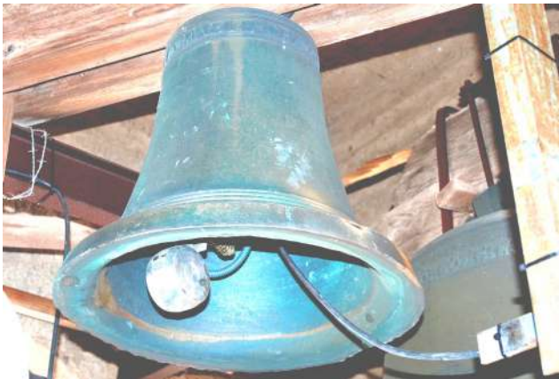
Campana antigua de San Salvador de Ibañeta datada en 1662, hoy en la iglesia de Auritz Burguete.

Pero para entonces el templo parroquial de la villa que había sufrido un incendio en su torre y coro el 6 de septiembre de 1861 estaba en reconstrucción y carecía de las campanas ya que en el voraz incendio quedaron fundidas. Ante la falta de éstas, la carencia de medios económicos del Ayuntamiento y la necesidad de una por lo menos para el reloj que se estaba colocando en la nueva torre; es cuando la villa pide a la Colegiata una campana “como de diez arrobas que tiene en desuso” accediendo a la petición con la autorización del Sr. Obispo el 15 de septiembre de 1864 por la ayuda prestada en el incendio descrito.