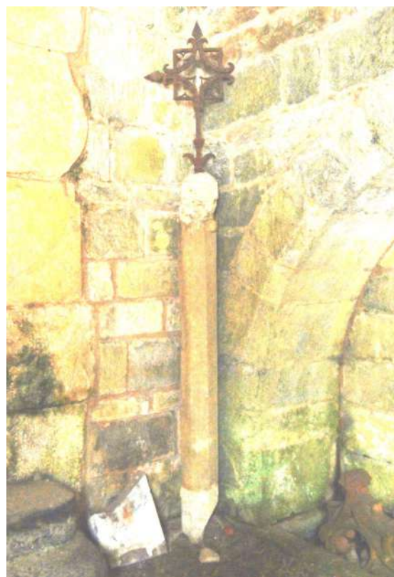
Fuste original del crucero, hoy depositado en el claustro de la Colegiata.

truida. El visitador ordenará reconstruirla. Y ordenará también poner una campana para aviso de alarma. Se debía tañer desde el crepúsculo hasta una hora después de medianoche para advertir a los pobres viajeros”.