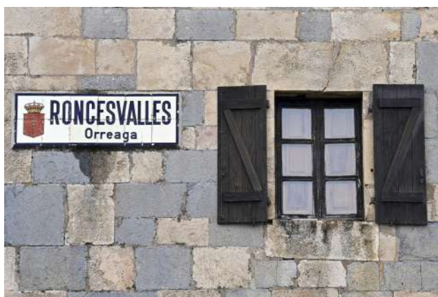
Conjunto de azulejos de 1922 rotulando las localidades navarras.