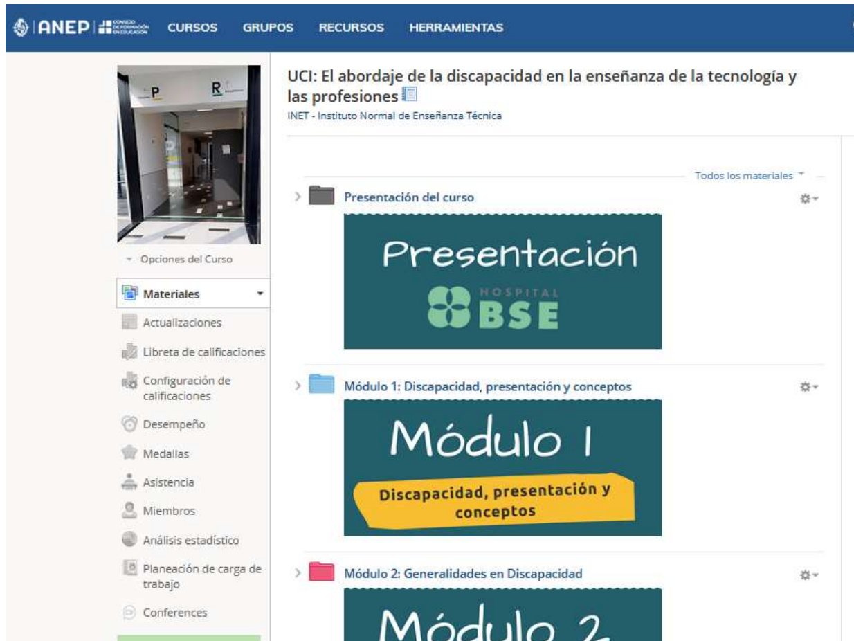
Figura 4. Curso “El abordaje de la discapacidad en la enseñanza de la tecnología y las profesiones” en plataforma

Como ya fuera explicado, para el desarrollo de esta unidad curricular las profesionales del HBSE contaron con el apoyo de los estudiantes del INET que hacían su práctica profesional como asistentes docentes en tecnologías digitales (perfil de Docente Orientador en Tecnologías Digitales, DOT). Las intervenciones consistieron en la orientación para el diseño de las guías de cada unidad, edición de videos, incorporación de audio en las presentaciones, producción de infografías, seguimiento de intervenciones en foros, es decir básicamente didactización de contenidos, respaldo en el manejo del sistema de comunicación del aula virtual, y supervisión del diseño y coherencia estética del curso entre otras acciones de respaldo.