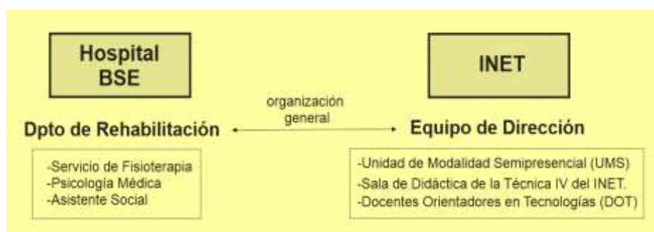
Figura 1. Principales actores del convenio HBSE-INET

En el apartado referente al diseño se describirán cada uno de los roles e interacciones de los equipos intervinientes, la metodología utilizada así como la organización general de la experiencia llevada a cabo.