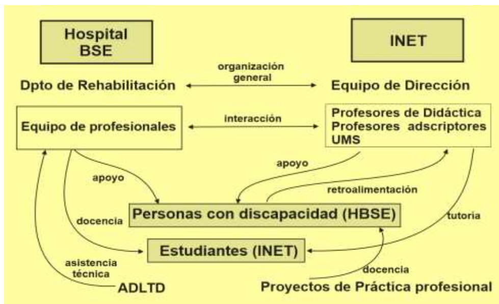
Figura 2. Esquema general de la experiencia y roles de los componentes (elaboración propia)

En el siguiente esquema (Fig.2) se muestran los principales componentes y roles que han cumplido. Como se puede observar por el entramado, esta experiencia ha implicado en todos los niveles un importante trabajo en equipo, el desarrollo de un excelente nivel de comunicación y colaboración y especialmente un alto nivel de involucramiento.