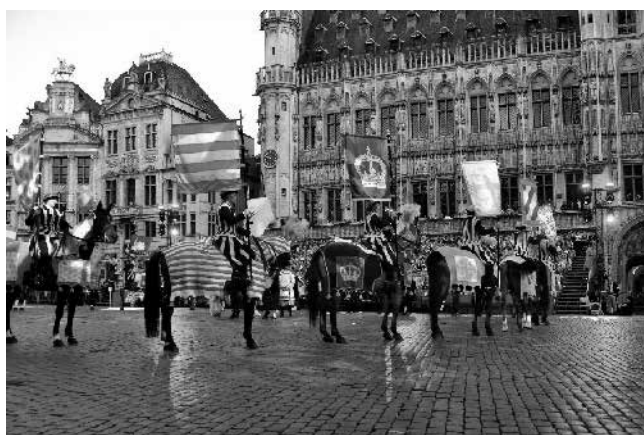
Varias escenas del Ommegang