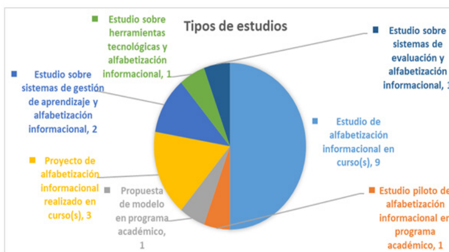
Figura 1. Tipos de estudios de las publicaciones estudiadas que representan las modalidades de enseñanza y aprendizaje en las que se ha aplicado la alfabetización informacional en la educación superior de tipo blended.

En la tabla 5 figura el detalle de los tipos de estudios, las modalidades, los principales conceptos estudiados en cada documento de investigación de la muestra y los autores de cada uno.