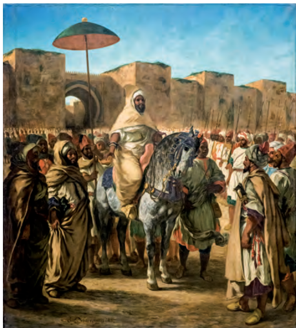
Fig. 2. Eugène Delacroix. Moulay Abd-al-Rahman, sultán de Marruecos saliendo de su palacio de Meknes rodeado por sus guardias y sus principales oficiales , 1845. Museo des Augustins de Toulouse, Francia.

negación de Occidente como primera fuerza civilizadora. En este contexto, de manera simultánea a lo citado, se conforma dentro de los estilos románticos la corriente Orientalista un modelo que procura la exaltación de otras sociedades y culturas, que amalgamadas en el término inconcreto de “oriente” 8 consigue dotar de atractivo a todo aquello que se encuentra ajeno al progreso (fig. 2).