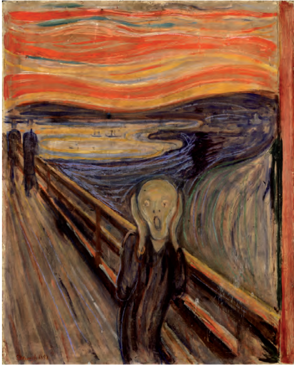
Fig. 1. Edvard Munch. El Grito , 1893. Galería Nacional de Oslo, Noruega.

aspectos como el concepto de Dios, de lo divino, de la misma verdad, no se constituían como resultado de procesos objetivos y mensurables, lo que hacía imposible su sometimiento a la lógica anterior 6 .