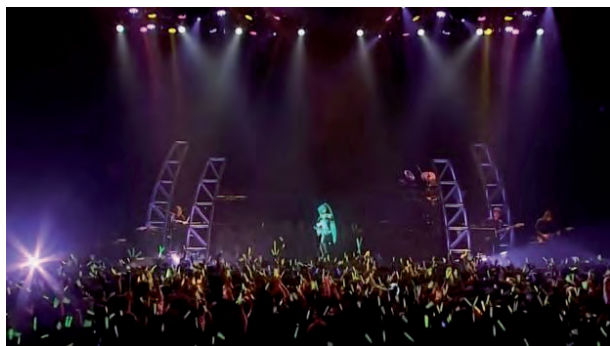
Fig. 15. Fotografía de un concierto en directo de Miku. Publicada en ABC cultura el 27/09/2019 para anunciar el concierto a celebrar el 28 de enero de 2020 en el Saint Jordi Club, Barcelona.

lo importante del arte no es lo humano, sino su esencia específica, el material, la textura... podemos entender que la única salvación es apostasiar de la historia, del arte, balbucear en vez de argumentar el pensamiento. Se nos puede hacer creer que la única verdad es subjetiva sin darnos cuenta que la subjetividad se agota en nosotros mismos y contribuye a nuestro aislamiento.