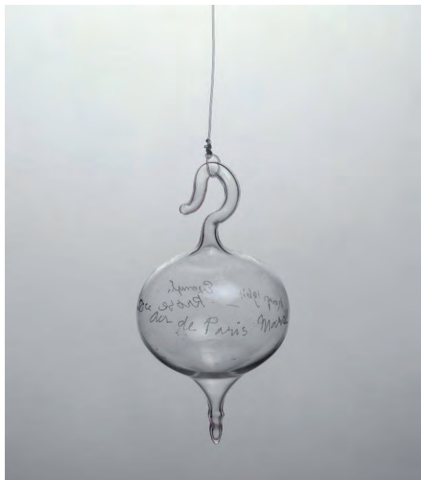
Fig. 7. Marcel Duchamp. Air de Paris , 1919/1964. Centro Pompidou. París, Francia.

seguridad de que sus derechos estaban exentos de cargas, consideraban que el único deber del hombre era ser feliz... Soflamos que se irán reforzando con imágenes conocidas pues comienza a funcionar el relato a partir de una o varias imágenes simples y muy reconocibles.