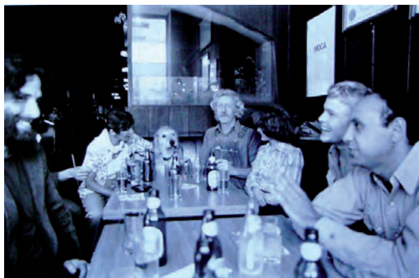
Fig. 10. Toni Marioni. “Tomar cerveza con los amigos es la forma más elevada de arte”, 1970. La obra consta de una barra en la que se sirve exclusivamente cerveza y dos mesas con sillas alrededor para sentarse.

el texto de Raoul Vaneigem escrito en 1967 22 en el que dicho autor realizaba un análisis del sistema capitalista y de la reducción del mundo a simple mercancía.