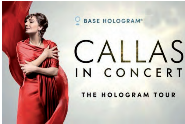
Fig. 14. Cartel anunciando la gira de María Callas (virtual).

Quiénes asistieron a su debut de regreso, eran conscientes de que María no estaba entre nosotros. Sin embargo, aun siendo consecuentes con ello, su presencia era difícil de negar. La diva cantaba acompañada por una orquesta real, perfectamente sincronizada. Se movía por el escenario luciendo diferentes trajes y para colmo, al final de su actuación lanzaba con sus manos una especie de confetti que caía sobre los espectadores. Aquello, aun no siéndolo, era real.