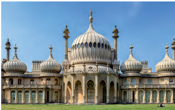
Fig. 4. Jonh Nash. Royal Brighton Pavilion , s.XIX. Brighton, Inglaterra.

Se trata de una ficción controlada que se presenta como verídica, pero es falsa. Una ficción que seduce ante la belleza de aquellos patios en los que reposan las mujeres, esas calles, en las que apaciblemente tocan los músicos, y en general el ambiente sensual que conduce a pensar en oriente como un ámbito de excepción para los placeres erótico-amatorios. Una seducción que se constata también a través de la arquitectura, donde los palacios, chalets y casas en general, participan de la seducción exótica como puede verse en el pabellón real de Brighton de Jonh Nash (1823) ( fig. 4 ), en las decoraciones orientales de gran cantidad de salones, o en los diseños de moda, anteriores a la Primera Guerra Mundial, de Paul Poiret.