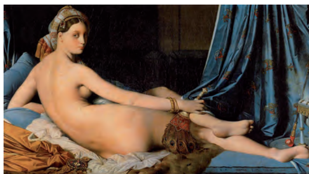
Fig. 3. Dominique Ingres. La gran odalisca , 1814. Museo del Louvre, París, Francia.

El movimiento, desarrollado a lo largo de un amplio periodo y una extensa geografía, irá depurando su discurso para acercarlo a un público cada vez más numeroso. Sus representaciones no requerían ya la presencia de un personaje heroico, como había sucedido en las pinturas de Jean-Leon Gérôme o Antoine-Jean Gros, ahora las escenas son cotidianas, algo que las acerca al público. Un intimismo en el que el espectador se siente confortado. Un tratamiento sugerente de la luz, que aclara y contrasta los