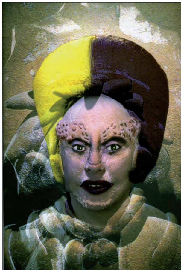
Fig. 13. Orlan. Auto-Hibridación precolombina , 1998.

Lo humano, el propio cuerpo parece hacerse incómodo, promoviendo otra modelización del mismo. Transformar lo humano insertar elementos dónde no corresponde o que no corresponden, parecen tender a transformar la iconografía inoculando en nuestra mente la imagen de humanoides robotizados, cuando no de muertos que laten alrededor nuestro como hace el alemán von Hagens con sus cadáveres plastimetados 31 , o el estadounidense Damien Hirst con sus animales introducidos en cubetas de aldehidos 32 .