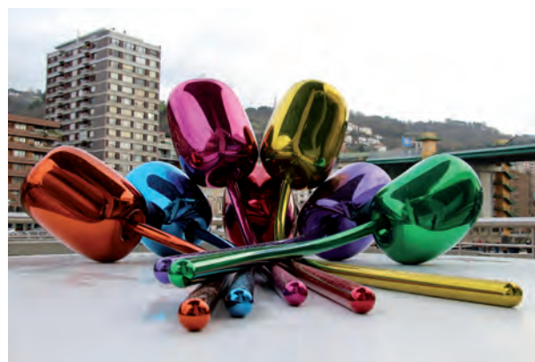
Fig. 11. Jeff Koons. Tulipanes, 1995/2004. Guggenheim Bilbao, España.

¿Qué sesuda reflexión puede haber detrás de ese perrito copia del que hacen con globos los feriantes? ¿Cuál el mensaje del brillante corazón rojo que pende de un lacito dorado...? ¿Podemos señalar que hay en estas creaciones algo memorable, algo que nos vincule a la historia, al pensamiento anterior, algo que nos abra puertas al futuro? Temo que no. Ahora bien, sus formas sus colores no nos molestan, son agradables, no contienen nada, pero precisamente por ello, su “no mensaje” no nos agrede.