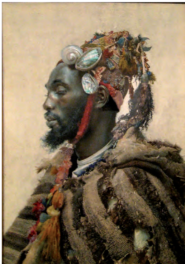
Fig. 5. José Tapiro y Baró. Retrato , 1890. Colección particular. Barcelona, España.

rinetti 10 . El Futurismo ponía en igualdad a la Venus de Milo con una locomotora, expresando su abominación por el patrimonio que la historia había dejado, una rémora que, en opinión de este movimiento, impedía el avance a las naciones. Exaltados ante la velocidad la juventud y la guerra, los futuristas apostaban por romper el cordón umbilical que unía el pasado con el presente. No eran los únicos, pues si profundizamos mirando en perspectiva, la