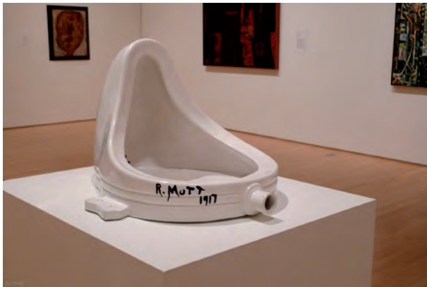
Fig. 6. Marcel Duchamp. Fuente , 1917. Museo Arte Moderno de San Francisco, E.E.U.U.

tar la emoción estética, lo único que se precisaba era retirarlo de su contexto (fig. 6).