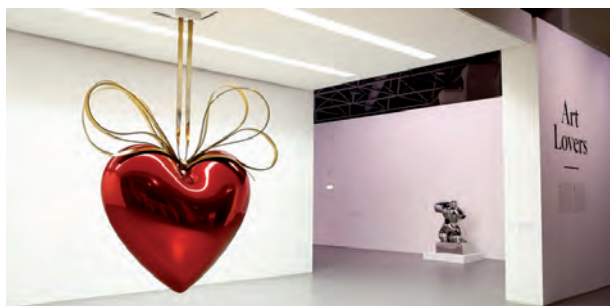
Fig 12. Jeff Koons. Hanging Heart , 1994.

rado dicho equilibrio corrompiendo la materialización de lo bello, probablemente porque su totalidad nos desborda. En paralelo, la acepción “bello” ha ido degradándose sustituida por otros términos más inócuos; bonito, gracioso, mono, llegando en la actualidad a emplear el de “cuqui”. Tanto el corazón de Koons, como su perrito quedarían fuera del término bello correspondiéndoles en todo caso el de mono o cuqui. Son piezas insignificantes ajenas a lo que Trias apunta como arte (fig. 12).