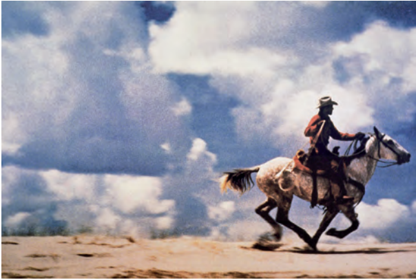
Fig. 9. Richard Prince. Untitled cowboy Fotograma del anuncio de Marlboro, 1989.

El arte contemporáneo buscaba sorpresa, no emoción y su objetivo, cada vez más alejado de la aspiración de trascendencia, se refugiaba en cierta transgresión pueril que constantemente debía cambiar a fin de mantener la sorpresa del espectador y con ella, la necesidad de consumo.