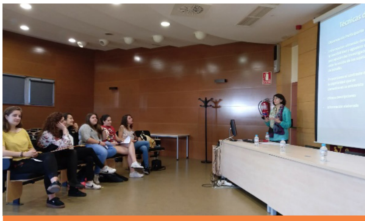
Fotografía 2. Instantánea del curso con estudiantes voluntarias

El límite temporal de cada una de las asignaturas condujo a no poder practicar el análisis de datos en el curso de las mismas, por lo que esa fase del proceso de investigación se reservó para un curso de libre elección (fotografía 1) al que se invitó a participar al alumnado, ofreciéndose voluntarias varias estudiantes para presentar públicamente los pasos de la investigación que habían realizado (fotografía 2).