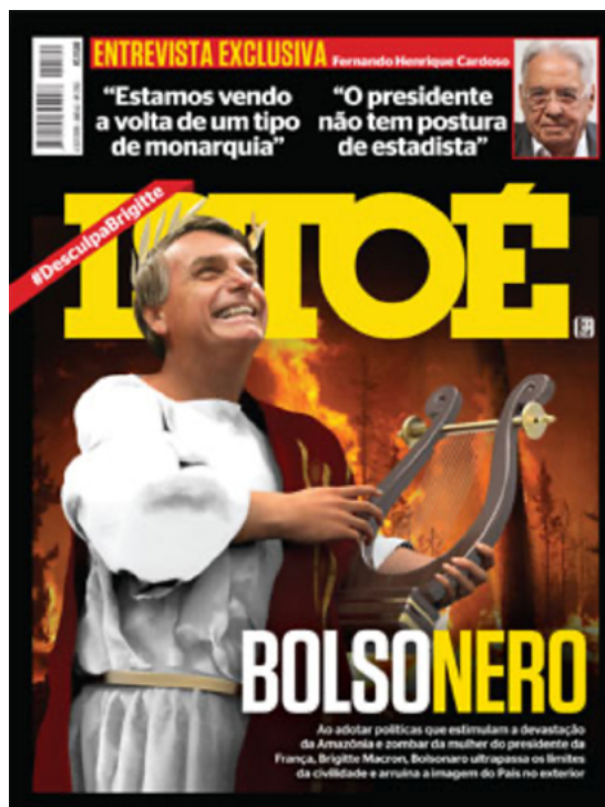
Figura 2. Revista IstoÉ, edição n°2592, 30/08/2019.

Aproveitando a temporada de queimadas na Amazônia, a revista associa o presidente do Brasil, Jair Bolsonaro, a um imperador que Roma teve, o Nero. Critica-se a política do presidente que, segundo a revista, é uma “retórica incendiária e antiambiental” que destrói a imagem do país no exterior.