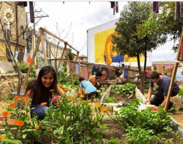
Figura 6 Huerta Comunitaria RE. Imágenes de la comunidad y del proceso.