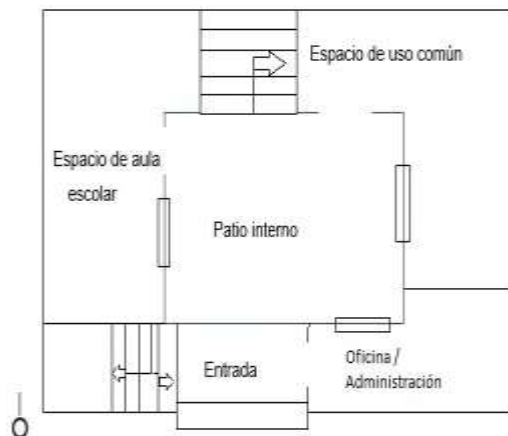
Figura 1: Esquema de distribución de la planta inferior del Centro Cerrado.