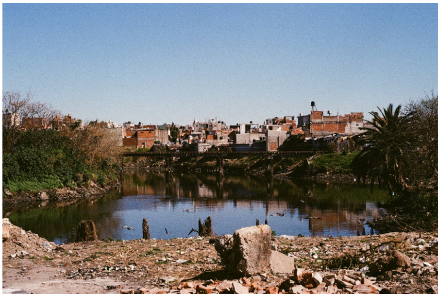
Figura 2. Ribera de la Villa 21-24 de Barracas en la ciudad de Buenos Aires

El PISA tuvo más de diez líneas de acción que abordaron la complejidad de la problemática ambiental de la cuenca. Entre ellas encontramos las de “contaminación de origen industrial”, “saneamiento de basurales”, “ordenamiento ambiental del territorio”, “liberación de márgenes y camino de sirga”, “urbanización de villas y asentamientos precarios” y “expansión de la red de agua potable y saneamiento cloacal”. Una parte importante de las acciones delineadas en el plan (en particular las nombradas) tenían por objeto los asentamientos informales localizados en la cuenca y sus habitantes y, en especial, aquellos radicados en la ribera a lo largo del río. Las políticas vinculadas a