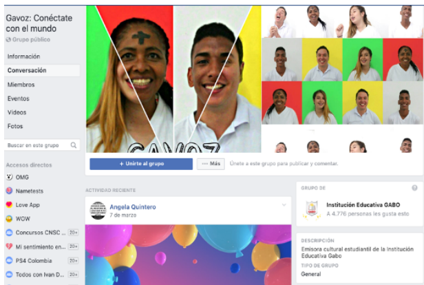
Figura 1. Grupo en Facebook

De igual manera, los estudiantes que participan de este espacio cumplen perfiles de redactores, narradores, libretistas, manejo de redes como el Facebook el cual se puede apreciar en la Figura 1 , quienes, a su vez son orientados por docentes que fortalecen y fomentan el buen uso de herramientas y medios tecnológicos que tienen a su disposición.