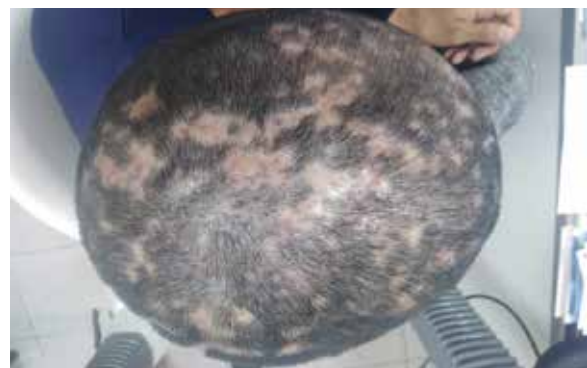
Figura 4. Posterior a dos ciclos de antibiótico, lesiones anulares de áreas de alopecia, algunas otras placas con repilificación, ya sin signos flogísticos.

El caso expuesto es llamativo por su escasa frecuencia, la presente puede dar pie al desarrollo de estudios o investigaciones mas detalladas y profundas