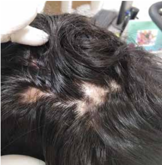
Figura 1. Nódulos en cuero cabelludo fluctuantes de varios tamaños, dolorosos.