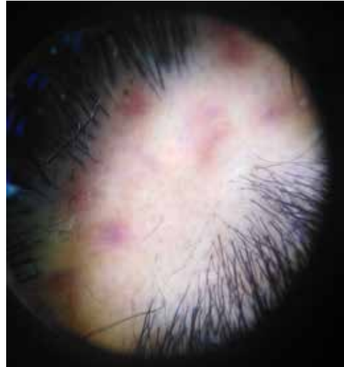
Figura 2. Tricoscopia presencia de puntos negros, puntos amarillos, vasos puntiformes, leve eritema interfoliular, algunos folículos vacíos.

Se han evidenciado también buenas respuestas con ciclos de antibióticos con rifampicina y clindamicina, poco viables en nuestro medio a la prevalencia de tuberculosis 1 .