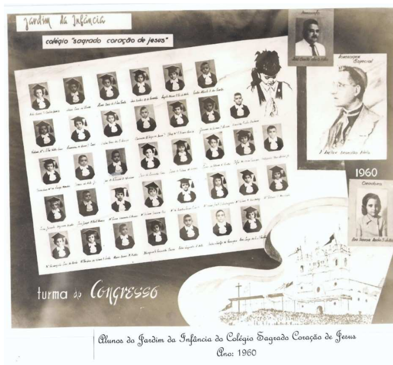
Figura 2 – Quadro de formatura - Jardim de Infância de 1960 8 (Turma do Congresso)