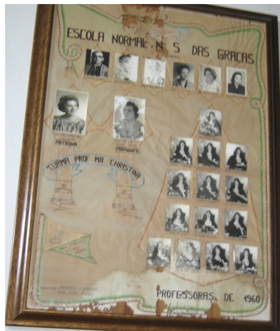
Figura 3 – Quadro de formatura-curso normal de 1960 (Turma Prof ª . Maria Christin)