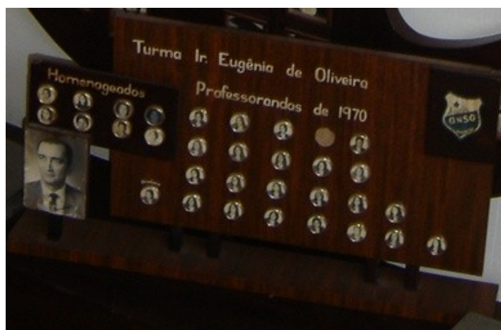
Figura 4 – Quadro de formatura – professorandas de 1970 (Turma Irmã Eugênia de Oliveira)