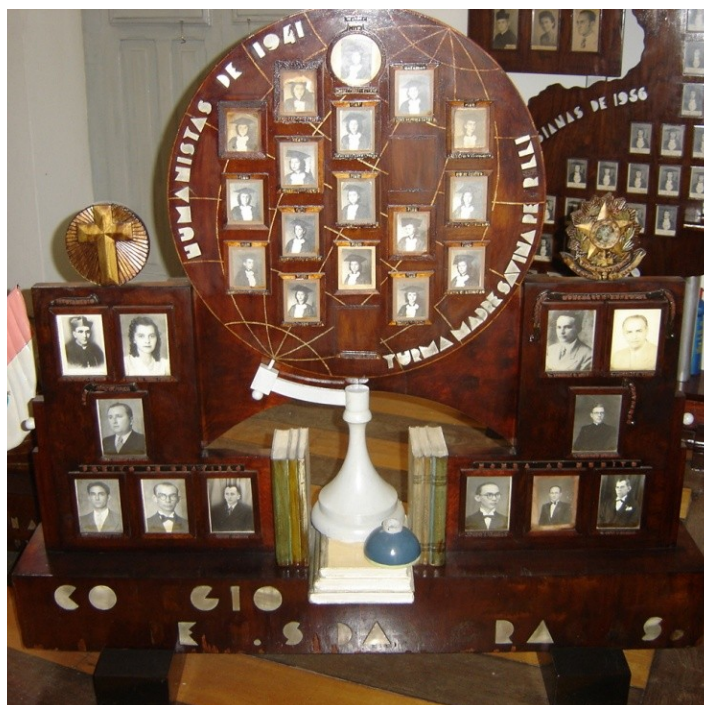
Figura 1 – Quadro de formatura-humanistas 6 de 1941 (Turma Madre Savina)