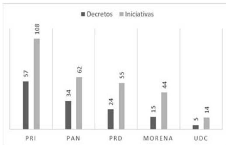
Figura 1. Eficacia legislativa por grupo parlamentario, 2018-2019

mado por 4 diputadas; mientras que el PRI por 7 y la UDC por 1 diputada. A lo anterior se hace una acotación, y es que a pesar de que los grupos del PRD y MORENA están integrados por una diputada cada uno, el porcentaje de eficacia parlamentaria es considerablemente alto, en términos porcentuales y absolutos.