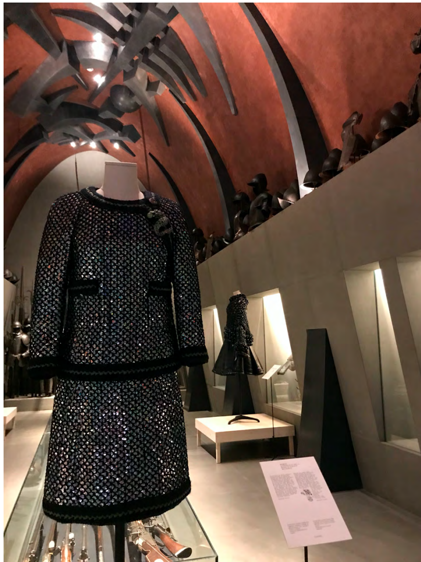
FIGURA 3 – COLEÇÃO CHANEL, PRÉ-OUTONO 2010