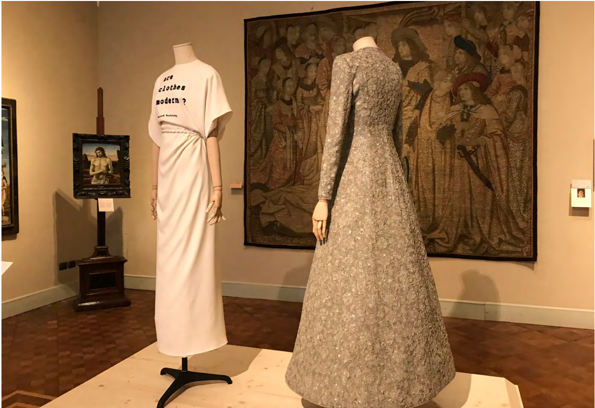
FIGURA 1 – COLEÇÃO ALTA-COSTURA DIOR, OUTONO/INVERNO 2019