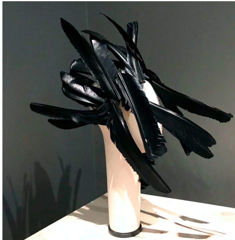
FIGURA 5 – COLEÇÃO COMME DES GARÇONS, PRIMAVERA/VERÃO 1994