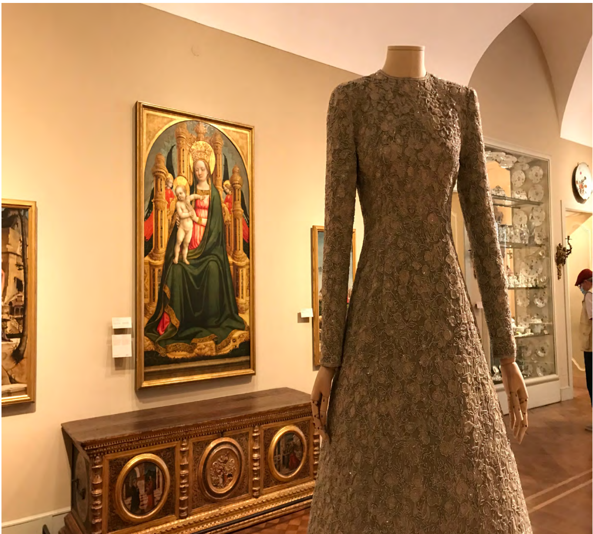
FIGURA 4 – COLEÇÃO GIORGIO ARMANI, VERÃO 1994

FONTE: Foto da autora realizada durante a exposição Memos , Milão, maio 2020.