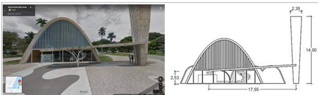
Figura 1: Igreja da Pampulha em Belo Horizonte (Google imagens 3 )

A atividade então foi projetada para ser realizada em três etapas. A primeira consistia no reconhecimento da curva (parábola) em imagens existentes na Arquitetura e no cotidiano dos alunos. Segundo Machado (2007), “não tem como ignorar a presença das parábolas no dia-a-dia, portanto, é necessário que se dê o seu devido valor, mostrando aplicações quando forem abordadas durante as aulas” (p. 9).