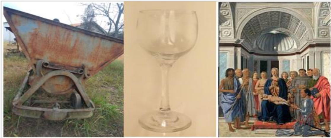
Figura 2: Imagens de formas de parábolas retiradas dos trabalhos dos estudantes

trabalhadas em sala de aula, de uma forma quase sem utilidade; é necessário explorar este conteúdo, abordando algumas aplicações das parábolas, mostrando que são essenciais na construção de objetos comuns no cotidiano, tornando este assunto mais significativo.