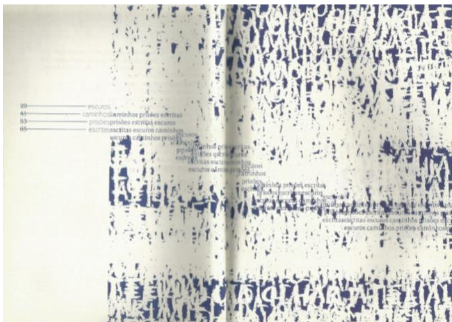
Figura 3 – Sumário de Exercícios de uma escrita menor: um olhar atelial (Farina, Garavelo e Fonseca, 2014)

A publicação é organizada em quatro seções, como vemos no Sumário – escuros; caminhos; prisões; escritas – em traços finos, num jogo de repetições sobre a página, lembrando mais um rascunho, ou um sumário provisório, que dá acesso a paisagens expressivas que dizem de uma percepção fugidia e sempre sujeita a múltiplos contágios, vazios e silêncios, como num palimpsesto (Figura 3). Tudo depende da estratégia do olhar, e da escuta, a fim de fazer falar o desejo, a memória, o conflito, as imagens subterrâneas.