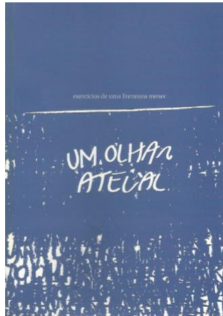
Figura 2 – Capa de Exercícios de uma escrita menor: um olhar atelial (Farina, Garavelo e Fonseca, 2014)

A publicação é organizada em quatro seções, como vemos no Sumário – escuros; caminhos; prisões; escritas – em traços finos, num jogo de repetições sobre a página, lembrando mais um rascunho, ou um sumário provisório, que dá acesso a paisagens expressivas que dizem de uma percepção fugidia e sempre sujeita a múltiplos contágios, vazios e silêncios, como num palimpsesto (Figura 3). Tudo depende da estratégia do olhar, e da escuta, a fim de fazer falar o desejo, a memória, o conflito, as imagens subterrâneas.