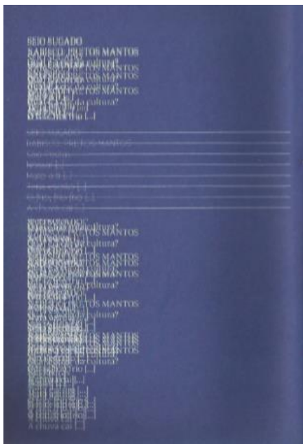
Figura 4 - Página interna de Exercícios de uma escrita menor: um olhar atelial (Farina, Garavelo e Fonseca, 2014)

As páginas no interior do livro alternam tons de azul, texturas e sobreposições de letras (Figuras 4 e 5). Na sua configuração material, o livro diz de uma performance da escrita, que passa pela atuação do corpo, materializando o gesto que ensaia letras sobre o papel.