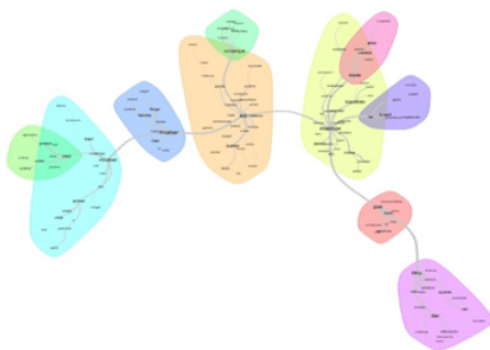
Análise de similitude da Classe 1: "Responsabilidade dos pais e da Lei"