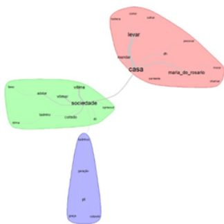
Análise de similitude da Classe 2: "A responsabilização da Política e dos Direitos Humanos"