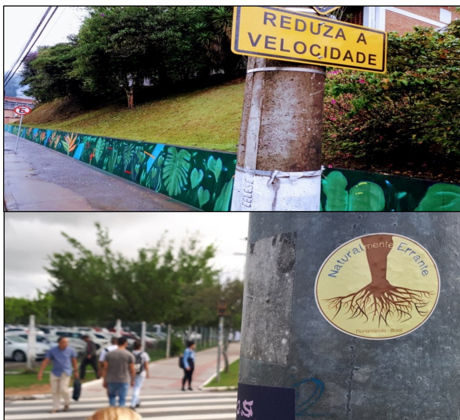
Figura 2 - Des-velo-cidade, Blumenau/SC e Florianópolis/SC.

A maneira como me movimento, pela cidade, reflete na forma como a leio. A leitura de um corpo sobre outro corpo. Um corpo humano com todos os sentidos aguçados, lendo o corpo da urbe, emergindo escritos, grafias, imagens e narrativas plurais da troca entre os corpos. Os modos e meios de transporte, o trânsito, a mobilidade e a ocupação urbana estão no epicentro das discussões sobre cidade. O direito de acesso à urbe torna-se tão importante quanto os direitos fundamentais de qualquer pessoa, "os movimentos atuais [que reivindicam] o direito à cidade são movimentos estéticos no sentido de que novos regimes de sensibilidade estão sendo criados e processados. 32 Contraespaços, heterotopias, que se opõem aos espaços sedentários e higienizados, disparando diferentes horizontes. 33 Um gesto, um movimento, o tempo de deslocamento, alarga e abre outras perspectivas. Um corpo-urbano-errante que vibra pelas urbanidades que lhe apresentam, o "sensível e o imaginário nele dialogam com infinito refinamento, suscitando interpretações, ficções, perspectivas que dão origem a outros tantos corpos poéticos". 34 O corpo que pedala e/ou caminha pela cidade, podem ser corpos poéticos, que coreografa cotidianamente seus modos de viver a urbe e de redesenhá-la pelos diálogos e ritmos que se envolvem.