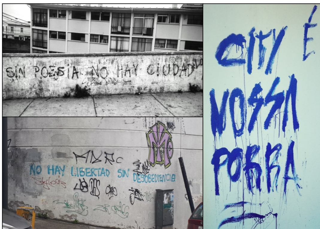
Figura 1 – Cidade poética, Valparaíso-Chile / Quito-Ecuador / Blumenau-Brasil.

Não quero com isso explicar quase nada, tão pouco criar definições acabadas. O que desejo é dar algumas pistas imagéticas de uma errância metodológica, um tecido errante costurado pelo caminho percorrido. Inundada por afetos e escutas e presenças insurgentes, provenientes de deambulações pelas cidades, busco revelar e expor a força do inútil, daquilo que é micro e marginal.