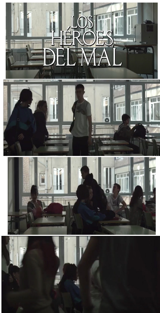
Fuente: De la Iglesia (productor) y Berriatua (director) (2015). Figura IV: Travelling inicial de «Los héroes del mal» (2015)