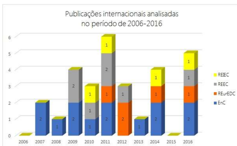
Figura 2 – Número de publicações internacionais selecionadas para análise em cada ano

Ressaltamos que no ano de 2016 encontramos um maior número de artigos para análise (7 artigos no total, publicados em quatro dos seis periódicos selecionados), seguido dos anos 2009 e 2010, com 6 publicações anuais. Como é possível constatar na Figura 1, foram encontrados poucos artigos nos outros anos que compreendem o período de busca realizada nos periódicos. A Figura 2 apresenta as publicações internacionais selecionadas para análise em cada um dos anos que compreende a nossa pesquisa bibliográfica.