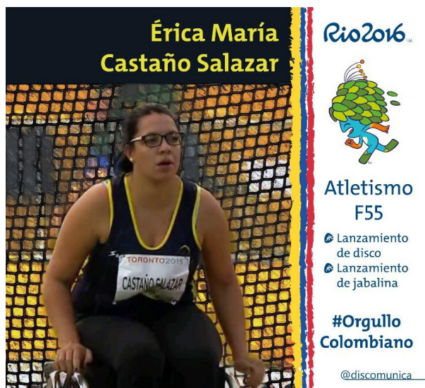
Figura 1. Flyer promocional de Discomunica