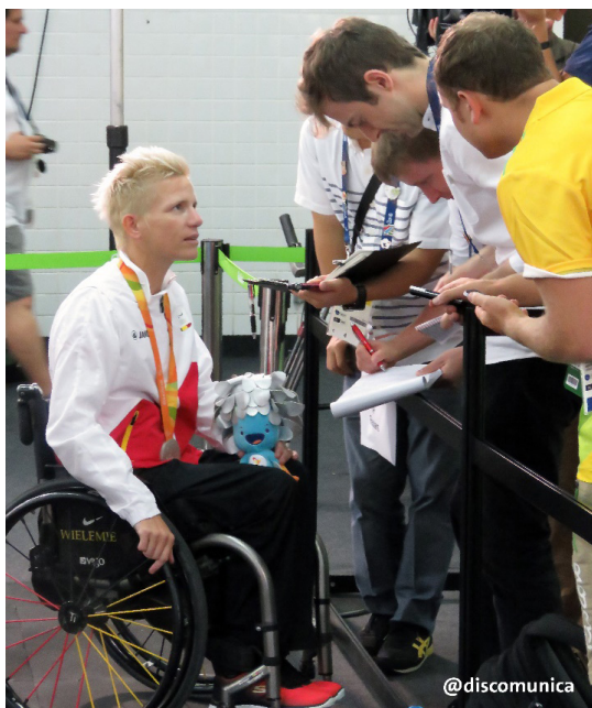
Figura 4. Zona de medios al finalizar competencias de atletismo