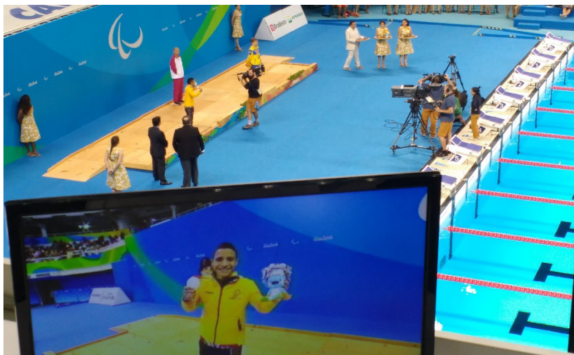
Figura 3. Zona de prensa en las piscinas de la ciudad olímpica