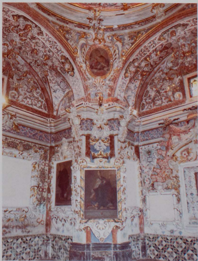
Camarín de la Virgen. Detalle.

En 1936, desaparecieron los lienzos de Gaspar de la Huerta que adornaban las capillas, más el retablo mayor, este último es de nueva planta y labrado íntegramente en madera.