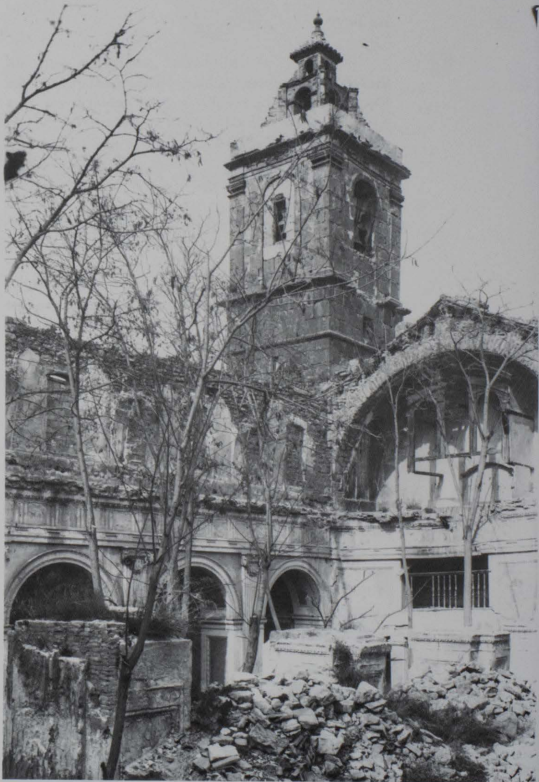
Ruinas de la vieja iglesia en los solares que hoy ocupa el ayuntamiento.