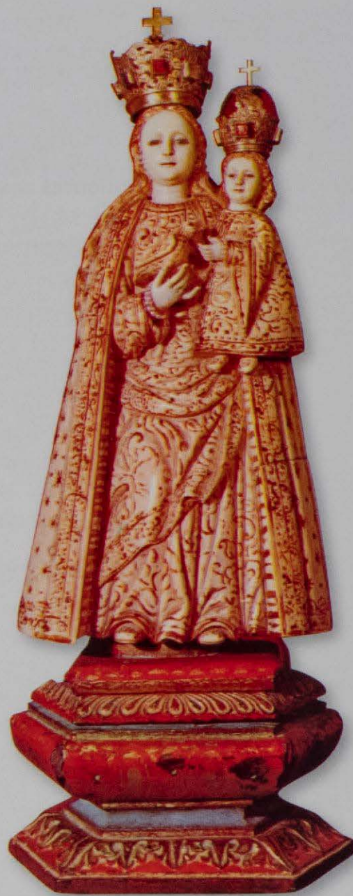
La Virgen "del colmillo". Talla del S. XV en marfil, de extraordinario mérito y de gran belleza.

El interior del convento, al ser de clausura, rara vez puede visitarse, excepto el coro bajo, situado al lado del presbiterio y separado de éste por una reja de grandes dimensiones, en él puede apreciarse la rica pavimentación de azulejo valenciano (Manises) del siglo XVII.