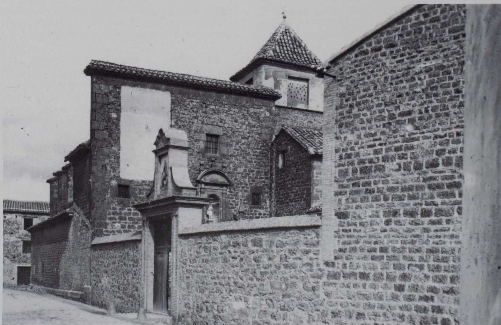
El convento de Carmelitas Descalzas de Caudiel, en una fotografía del año 1919.

Mientras se realizaban las obras del edificio conventual, los religiosos permanecieron en la ermita hasta el 25 de octubre de 1631, fecha en