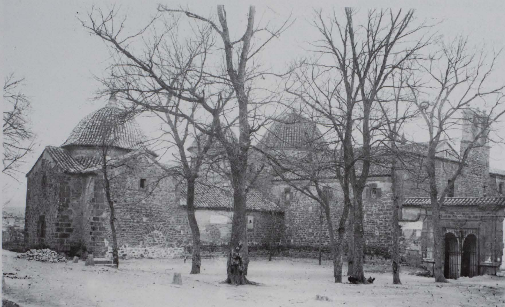
Ex-convento de los Agustinos utilizado durante muchos años como iglesia parroquial. 1919.

la que se trasladaron a sus nuevas dependencias. Posteriormente, el 26 de abril de 1665, se colocó la primera piedra de la Iglesia conventual, de manos del provincial de la Orden el Padre Fray Francisco de San Agustín. Esta primera piedra tenía forma de corazón (emblema agustiniano), y en su hueco se depositó una caja de plomo, también en forma de corazón, conteniendo algunas monedas del reino.