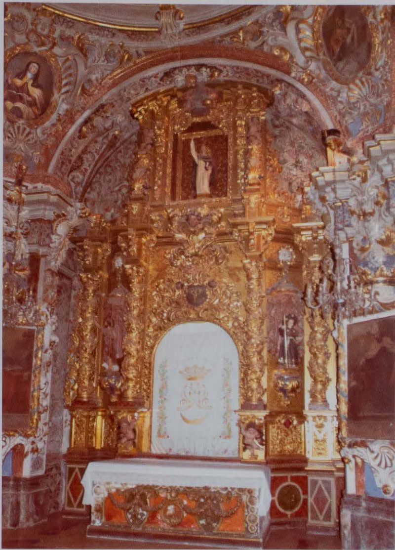
Camarín de la Virgen.