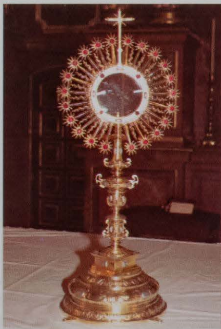
Iglesia parroquial de Caudiel. Custodia, siglo XVII.

Otros datos significativos de esta historia son: en 1667 se erigió la Cofradía de la Virgen por el Papa Clemente IX, en 1684 es elegida Patrona del Colegio; la primera fiesta pública (ininterrumpidamente hasta hoy), fue en el año 1649; originalmente la fiesta se celebraba el domingo siguiente de Reyes, hasta el año 1667 que pasó a celebrarse el cuarto domingo de septiembre, y finalmente, en 1958 al segundo domingo. La Pía Unión de Camareras de la Virgen, actualmente auténtica impulsora de la fiesta, se fundó en enero de 1933.