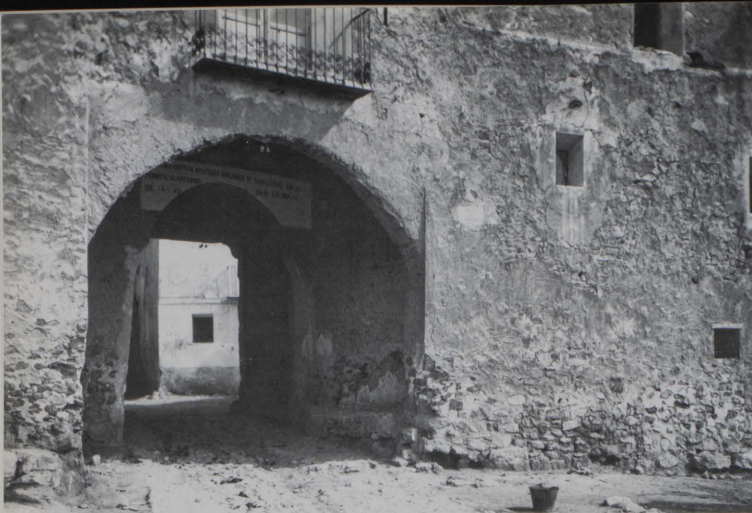
Antiguo portal de acceso a la villa.