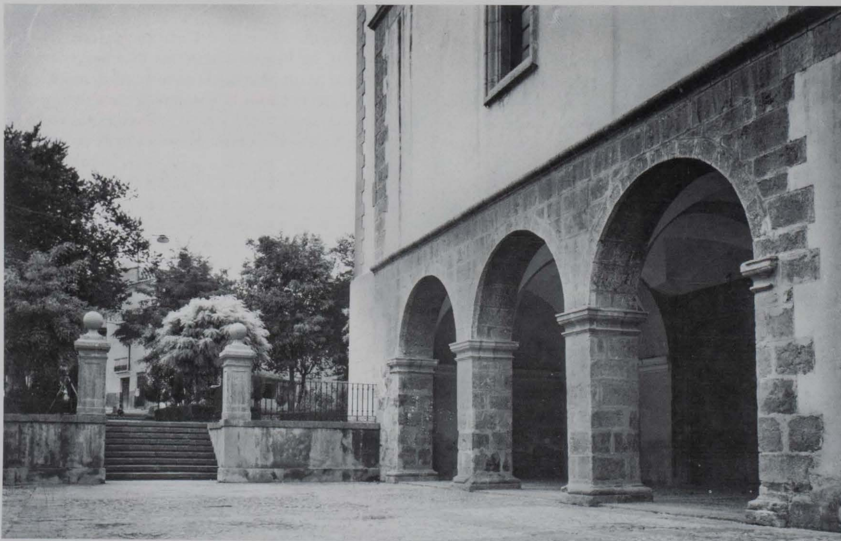
Santuario de la Virgen del Niño Perdido.