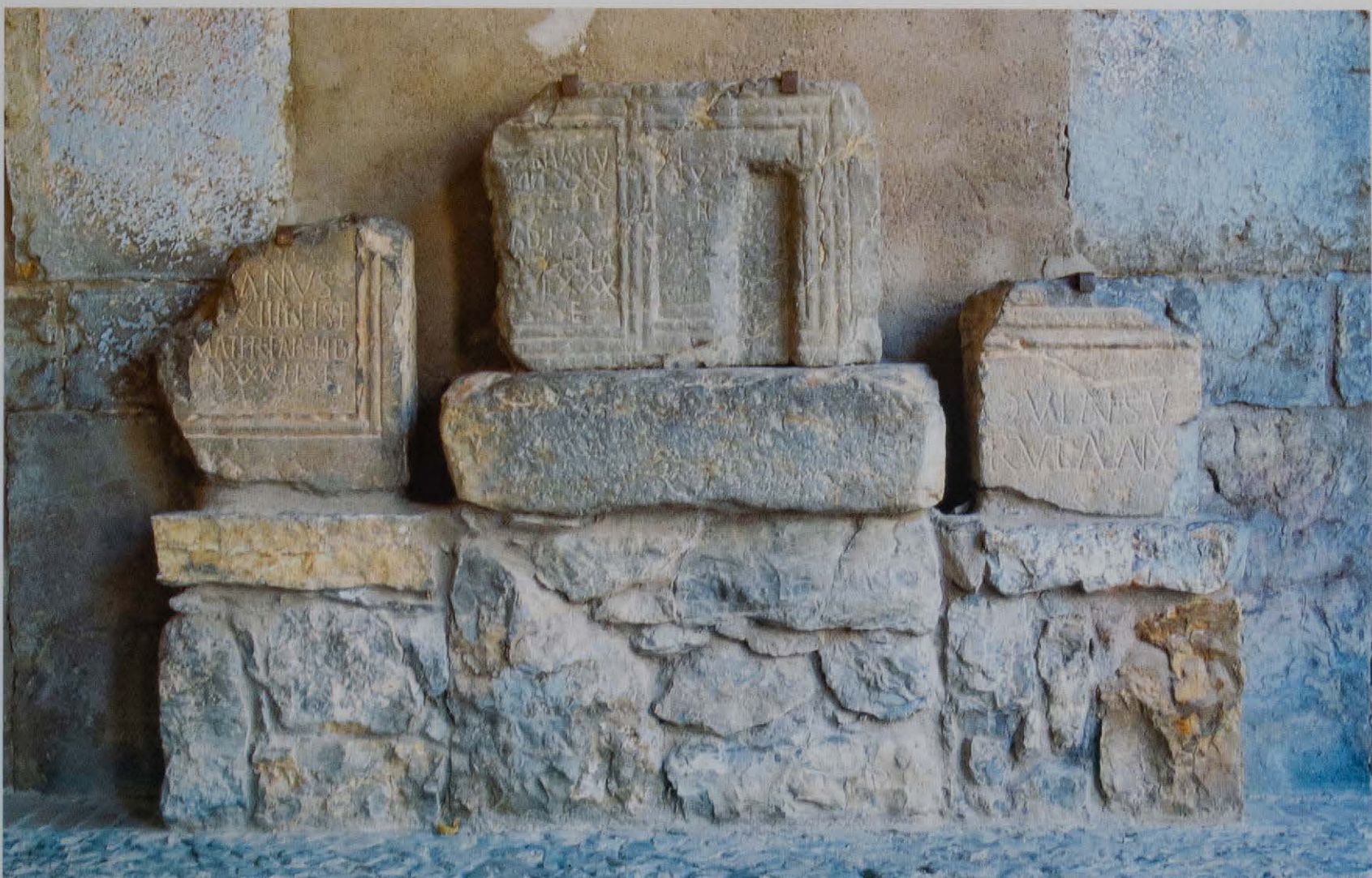
Conjunto de lápidas romanas halladas en el término municipal.

Posee estación de ferrocarril de la línea Valencia-Zaragoza. Es estación de término de los trenes