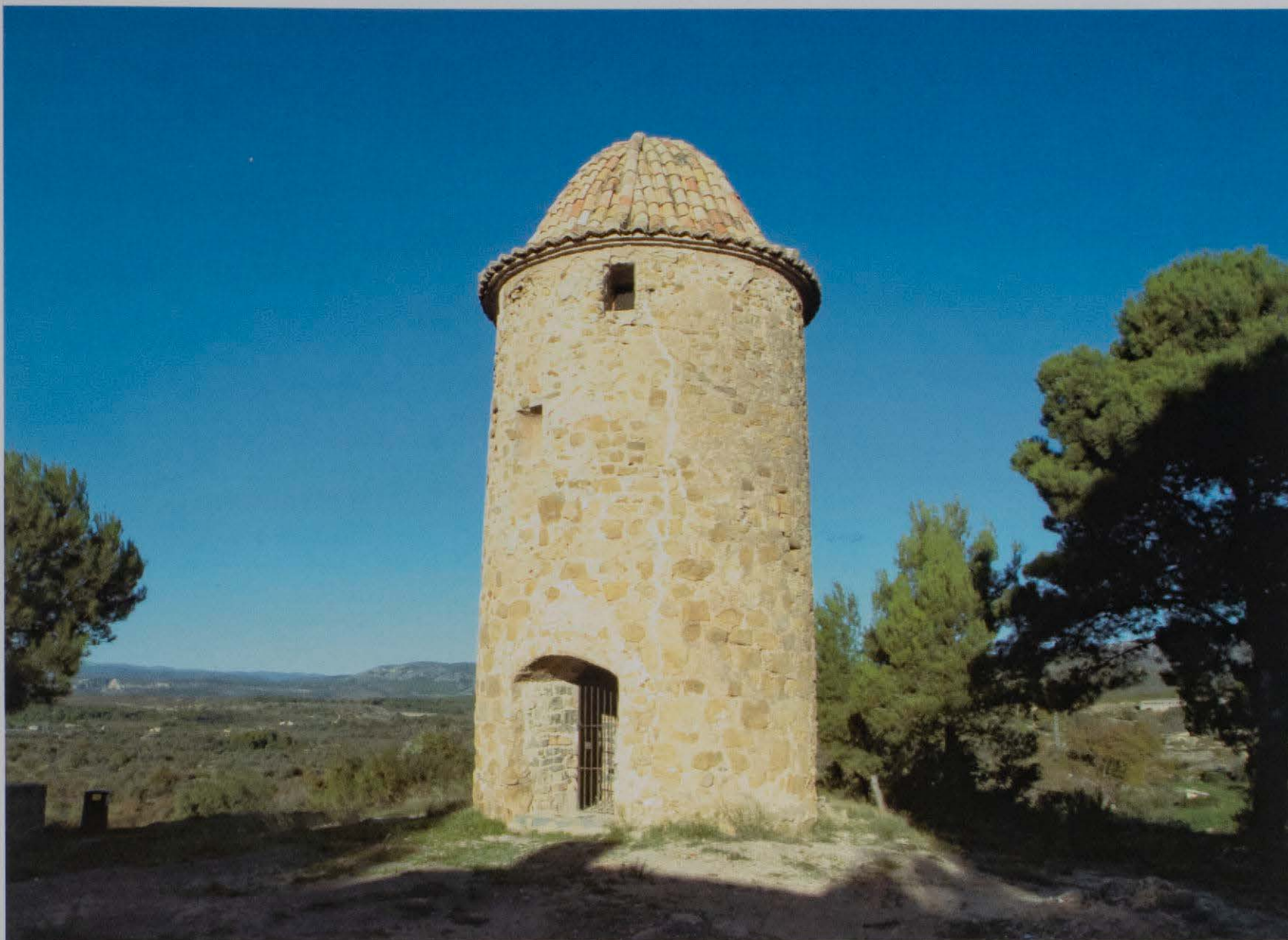
Torre del Molino. Atalaya de vigilancia contra las incursiones enemigas.

halladas en su término. Hay catalogadas cinco inscripciones: cuatro funerarias y una rupestre. De las funerarias, una de ellas se encuentra en paradero desconocido y las restantes están expuestas en el pórtico de la iglesia. La inscripción rupestre, está grabada sobre una roca en la Peña del Letrero, situada al lado izquierdo del denominado camino de Gaibiel (antigua calzada romana). En dicha roca, aparece la inscripción de un nombre indígena "Admonón", interpretándose que la calzada era de carácter privado.