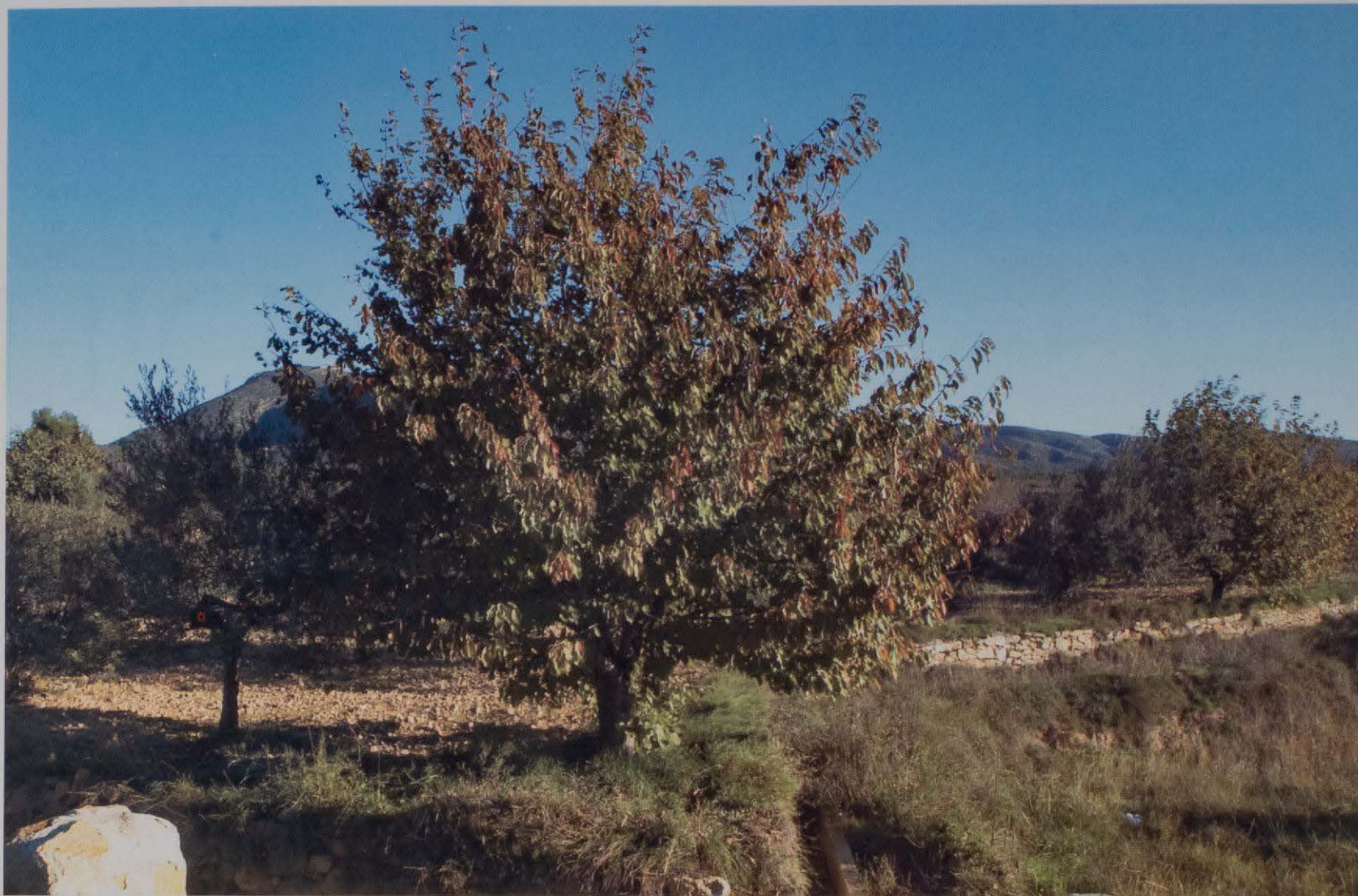
Paisaje agrario de Caudiel.

más de cuarenta fuentes, siendo las principales: El Consuelo, La Higuera, Heredad, Adadín, Cuenca, Alcabaira y El Cerrao, esta última, y según los resultados de la analítica efectuada, tiene propiedades diuréticas.