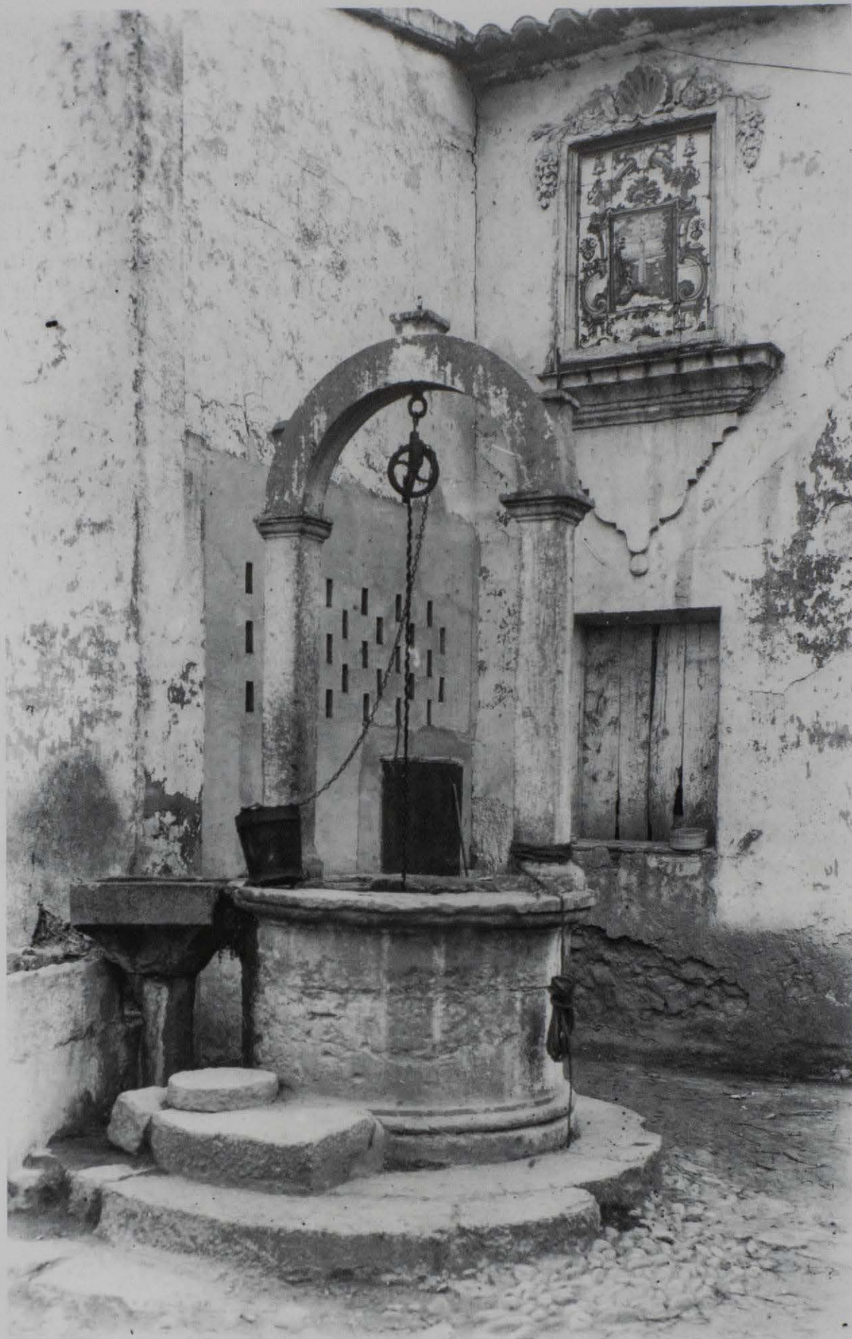
Brocal del pou situat al pati de la fàbrica de pisa fina del comte d'Aranda, a l'Alcora. Al'enderrocar la fàbrica el pintor Porcar comprà el brocal i després el va vendre a la Diputació. Fou col·locat al claustre de la Casa Beneficència. Foto Arxiu Más (any 1918)

Más. Prop de tres mil fotografies es van fer entre 1918 i 1919, d'una qualitat extraordinària, fixades en aquells suports negatius de vidre, que tanta fidelitat i contrastes donen a les còpies.