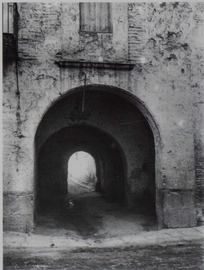
Nules. Portal de la muralla, avui inexistent. any 1919.

Foren quasi dos anys d'intensa activitat i molt poques coses d'interés restaren fora de la càmera dels Más, incloses visites a pobles molt petits, perduts a l'interior castellonenc, precisament en un moment en el que les comunicacions eren força complicades. Naturalment, foren els centres on més patrimoni existia, com era el cas de Morella, Sant Mateu, Sogorb o Castelló, on més es va projectar la tasca de Pelai