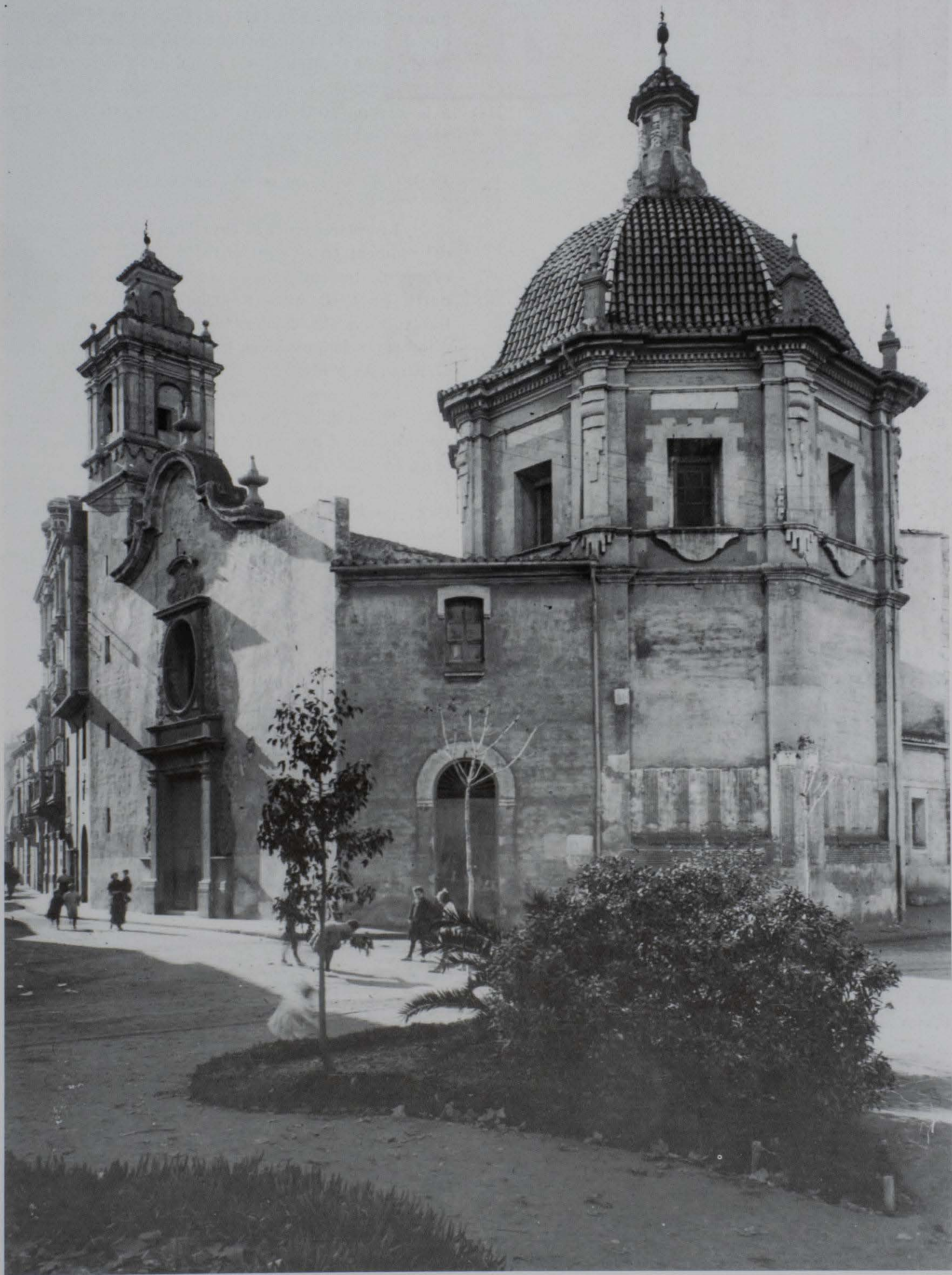
Castelló. Església de la Sang, enderrocada l'any 1936. any 1919.