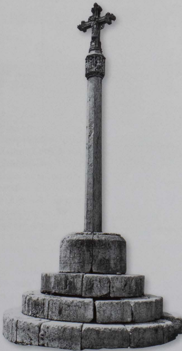
Benassal. Prigó del camí d'Ares o del saulonar. S. XVII. Desaparegué durant la guerra civil de 1936-39. any 1918.

* Tenim un deute d'agraïment amb el personal de l'Arxiu Más, que ens ha proporcionat una valuosa informació sobre la història de la casa i que ens ha resultat de tanta utilitat per poder enllestir aquestes línies que ara veuen la llum.