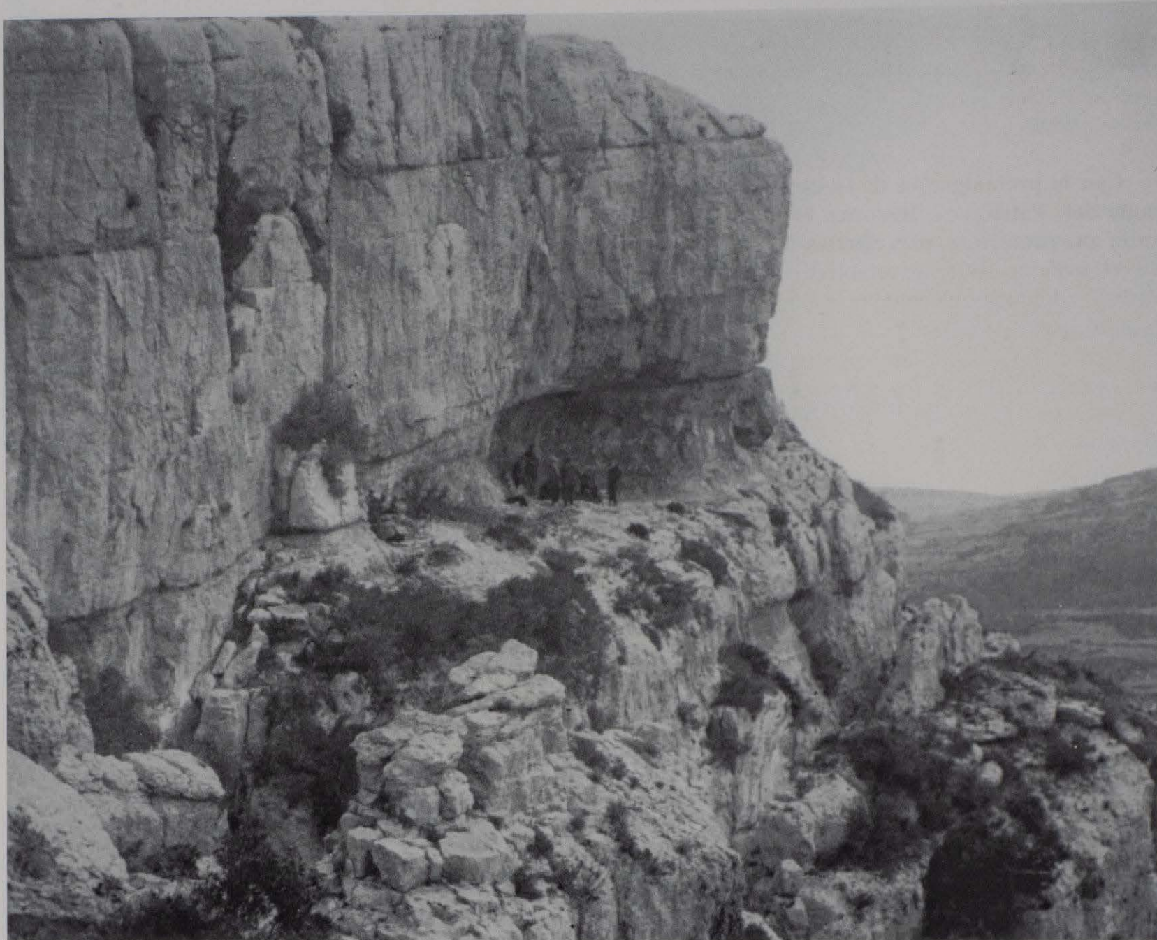
Figura 2. La Cova dels Cavalls, año 1917.

localizan los abrigos con arte rupestre. En este ámbito debía mantenerse inalterado el paisaje. En la zona 2 que incluía la ladera oriental de Montegordo y las laderas a ambos lados del barranco, se preconizaba la continuidad de los cultivos de secano y el mantenimiento de las construcciones existentes. Finalmente la zona 3 sería una aureola en torno a las anteriores a fin de amortiguar los impactos sobre las áreas protegidas.