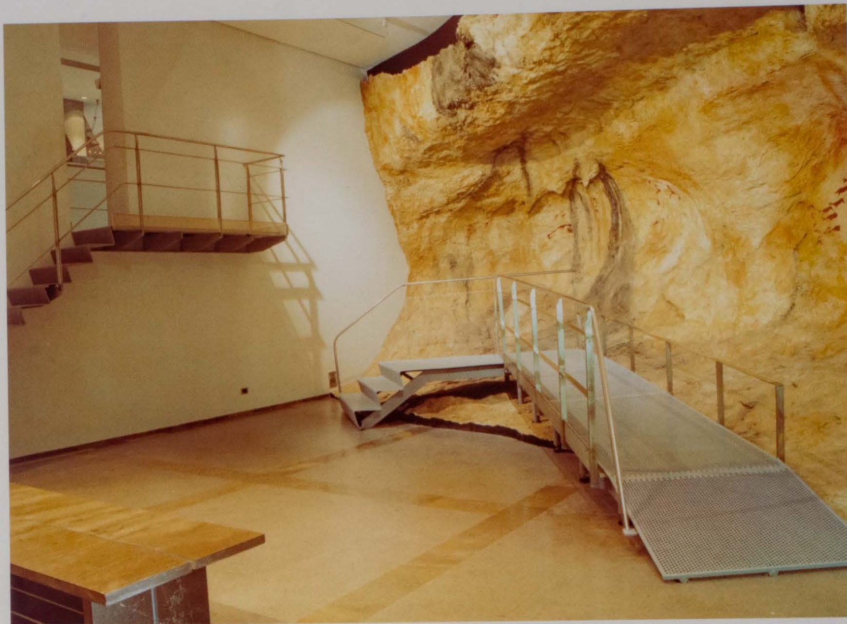
Figura 11. Sala 3 del Museu de la Valltorta: réplica de la Cova dels Cavalls.

El Museo es el punto de partida de las visitas guiadas a lo largo de los itinerarios del Parque. Actualmente la oferta consiste en la visita a seis conjuntos: la Cova dels Cavalls, les Coves de Ribasals o del Civil, La Saltadora, Mas d'en Josep, Cova Remigia y el Cingle de la Mola Remigia.