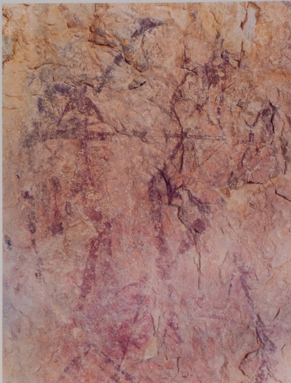
Figura 4. Detalle de la escena principal del abrigo III de les Coves dels Ribasals o del Civil, Barranc de la Valltorta (Tírig).

Actualmente la Dirección General de Patrimonio Artístico está elaborando el reglamento de Parques Culturales que será la herramienta que posibilitará su declaración y definirá las normas de funcionamiento.