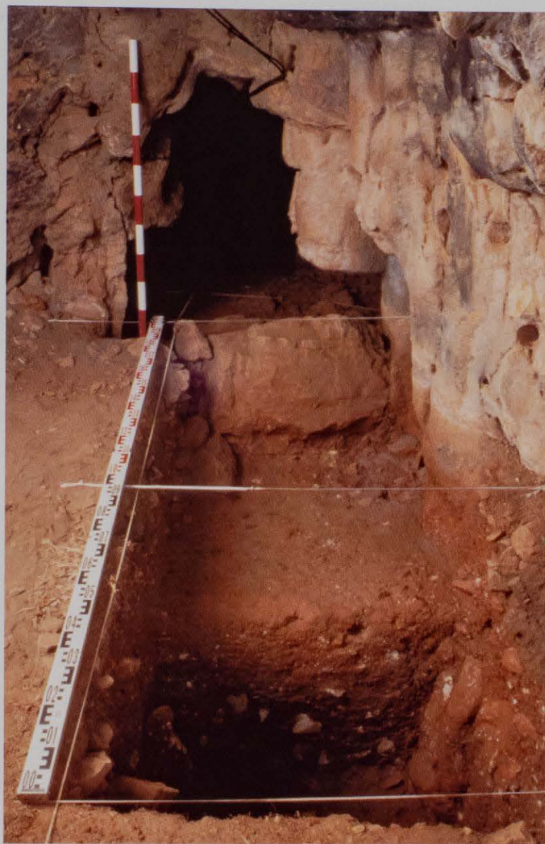
Figura 10. Excavaciones arqueológicas en el yacimiento de la Cova de les Tàbegues, Tírig.

De forma paralela hemos comenzado el estudio de los conjuntos de arte rupestre con la finalidad de optimizar la documentación existente y preservar este frágil patrimonio (Martínez Valle et alii, 2002). Esta