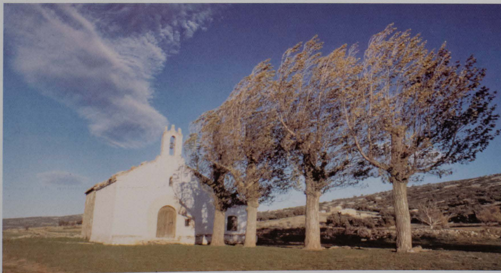
Figura 12. Ermita de la Virgen del Pilar (Catí).

-(1982): La Valltorta . Ediciones Castell. Barcelona.