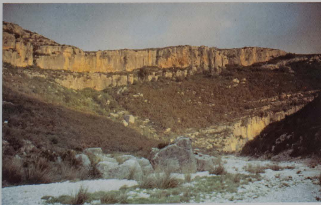
Figura 6. Vista general del Barranc de la Valltorta con los abrigos de La Saltadora al fondo

4. La integración de estos elementos en ecosistemas soporte de una variada vegetación y fauna.