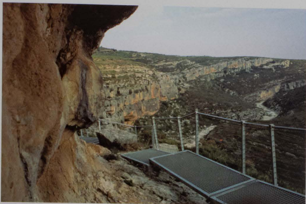
Figura 8. Cerramiento de abrigo visitable del Mas d'en Josep. Barranc de la Valltorta.

1. Protección. El Parque Cultural es uno de los Bienes de Interés Cultural incluidos en la Ley de Patrimonio Cultural Valenciano y por lo tanto, su creación supondrá el establecimiento de unas medidas de protección. Al igual que en otros BIC, la incoación del expediente de declaración determinará la aplicación inmediata del régimen de protección previsto por la Ley para los Bienes declarados.