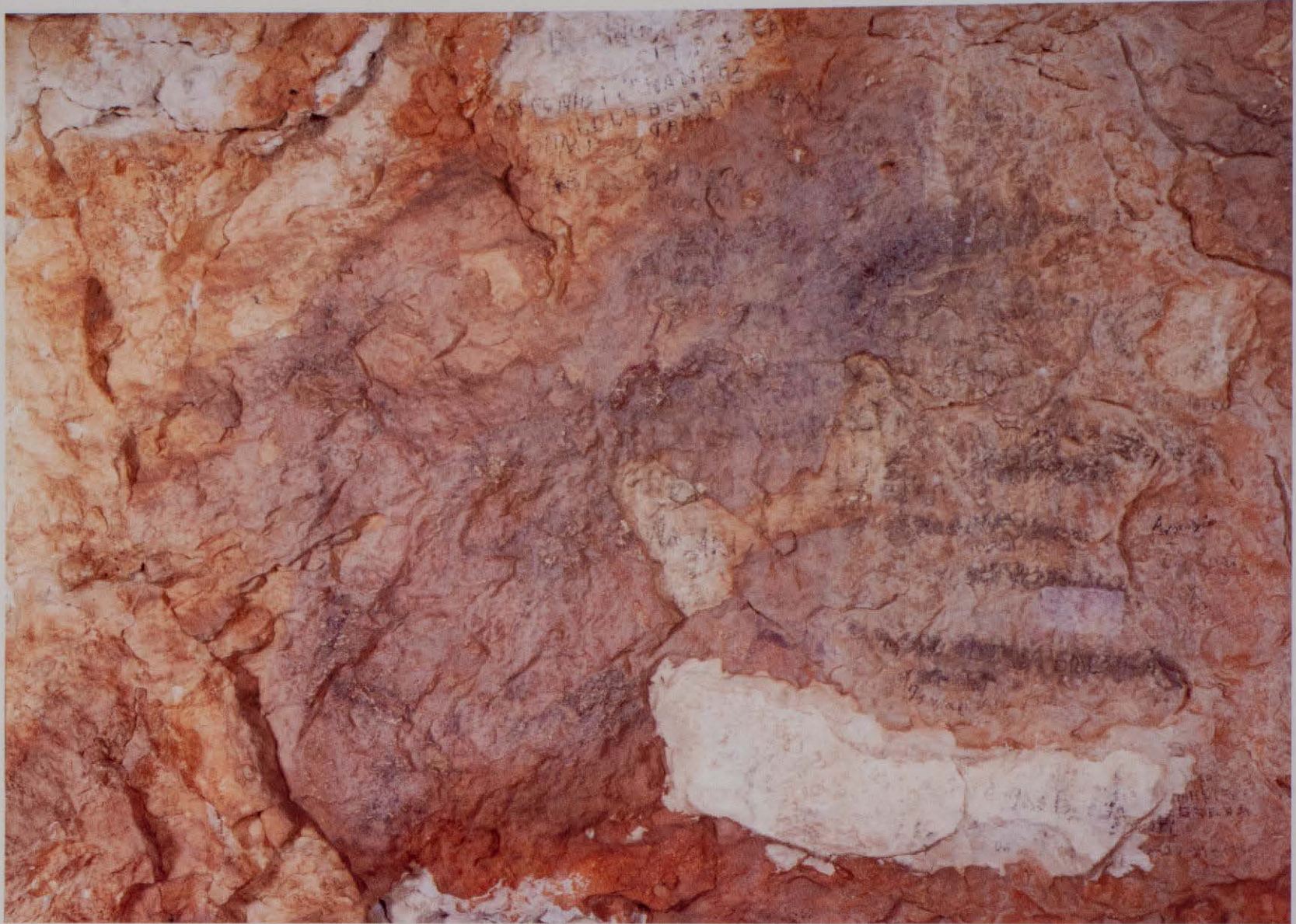
Figura 9. A. Cova dels Cavalls. Estado de las pinturas antes de la intervención de conservación preventiva. B. Detalle de la escena principal después de dicha intervención.