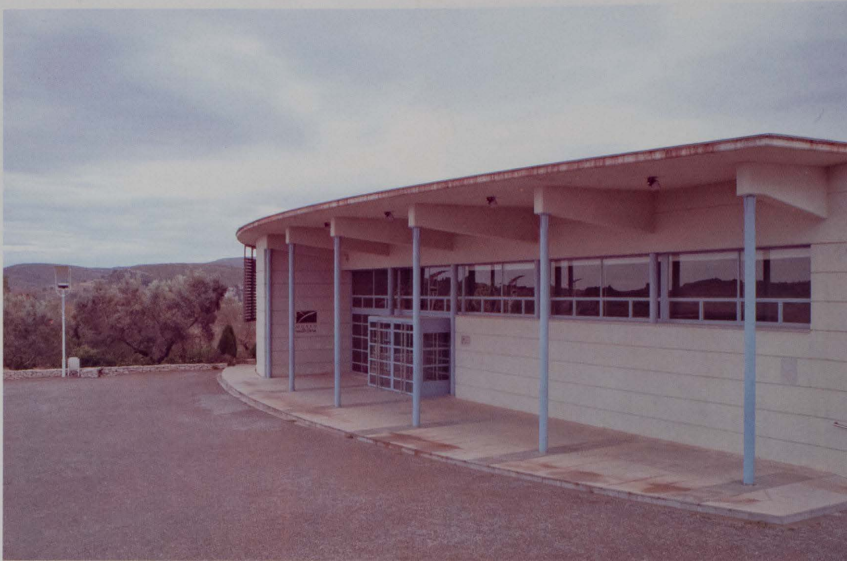
Figura 7. Museu de la Valltorta (Tírig, Castellón).

El área propuesta ha sufrido, al igual que otros territorios rurales de la Comunidad Valenciana, un despoblamiento acelerado en los últimos decenios, más acentuado en los periodos comprendidos entre los años 1910-1930 y entre 1960 y 1975. Respecto a la estructura de edades se ha producido un envejecimiento progresivo importante. El año 1994 la zona contaba con 5 000 habitantes de los que unos 1300 eran mayores de 64 años.