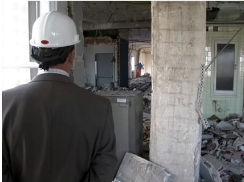
Figure 2. Overseeing the project. Edificio España (2012).

Naturaleza, lo monumental y las redes tecnológicas urbanas en Edificio España (2012) y La ciudad oculta (2018) de Victor Moreno