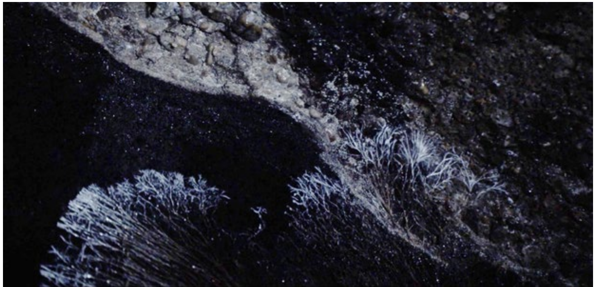
Figure 8. Organic organisms in Madrid's underground tunnels. La ciudad oculta (2018).

el transporte se mueven de aquí a allí, dentro y fuera, en procesos constantes de filtrado, extracción o escape. Tal y como señala Elden, “la geopolítica ha tendido a confundirse con la política global o con la geografía política a lo grande. Pero, ¿podríamos volver a emplearla para pensar en el suelo, la tierra y el mundo en lugar de simplemente lo global o lo internacional?” 20 Esta es la ambición de La ciudad oculta : llevar nuestra atención bajo tierra, en un sentido literal, considerar la verticalidad y el volumen del capital global, pero en esta ocasión privilegiando el aire, el agua, los animales, los insectos y la tierra como espacios públicos y como bienes públicos.