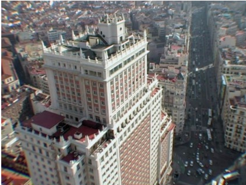
Figure 1. Opening shot. Edificio España (2012).

Naturaleza, lo monumental y las redes tecnológicas urbanas en Edificio España (2012) y La ciudad oculta (2018) de Víctor Moreno