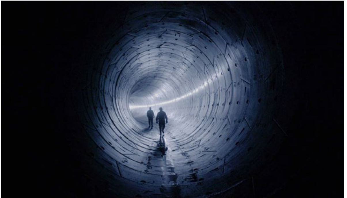
Figure 6. Traversing tunnels. La ciudad oculta (2018).