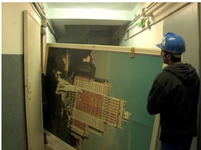
Figure 3. Removal of iconic imagery. Edificio España (2012).