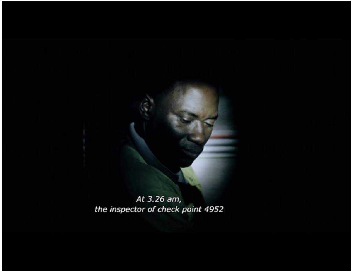
Figure 5. Track inspector. La ciudad oculta (2018).

Naturaleza, lo monumental y las redes tecnológicas urbanas en Edificio España (2012) y La ciudad oculta (2018) de Victor Moreno