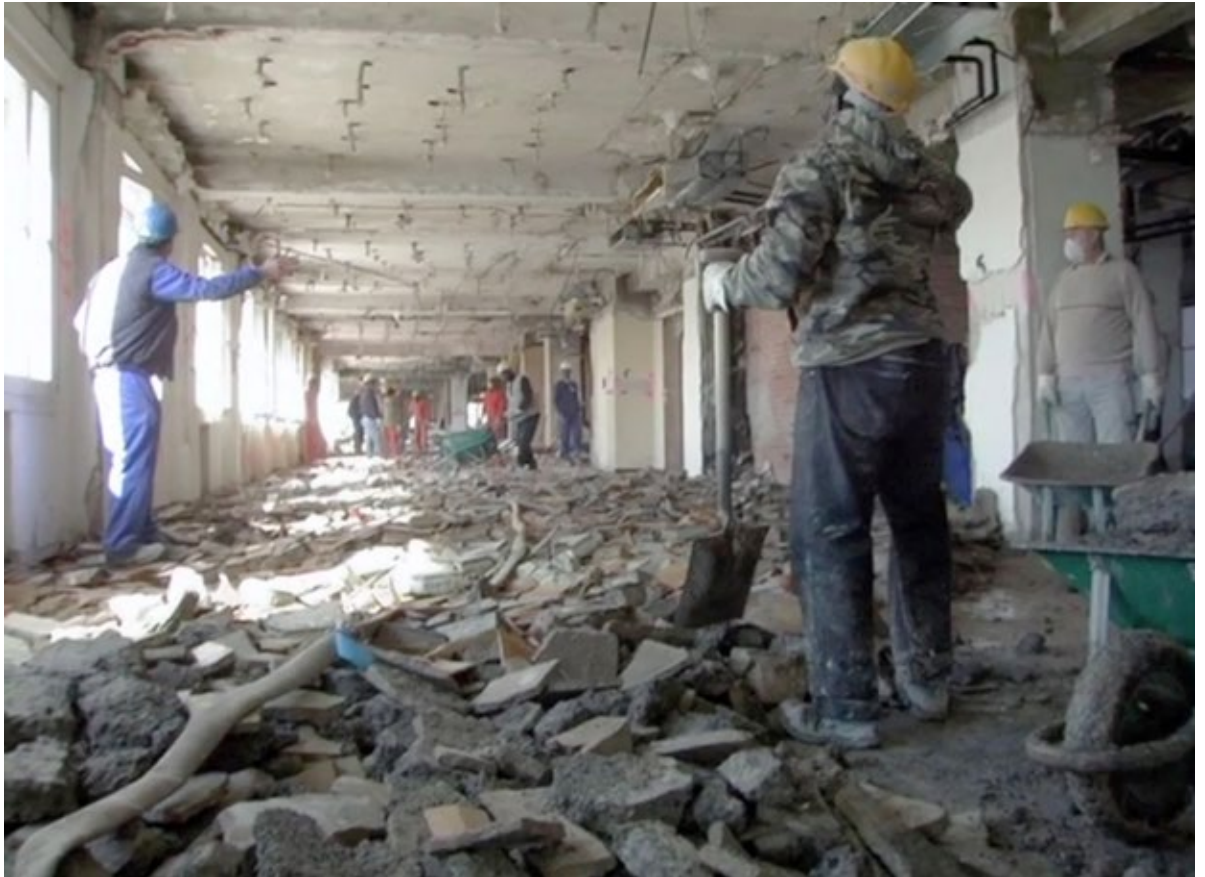
Figure 4. Demolition work. Edificio España (2012).

Naturaleza, lo monumental y las redes tecnológicas urbanas en Edificio España (2012) y La ciudad oculta (2018) de Víctor Moreno