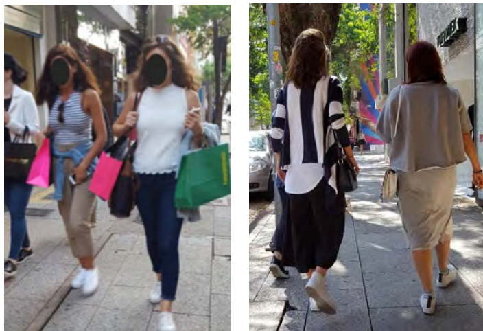
FIGURA 4 – O TIPO SEGUIDOR

FONTE: Acervo da autora, rua Oscar Freire, 2016.