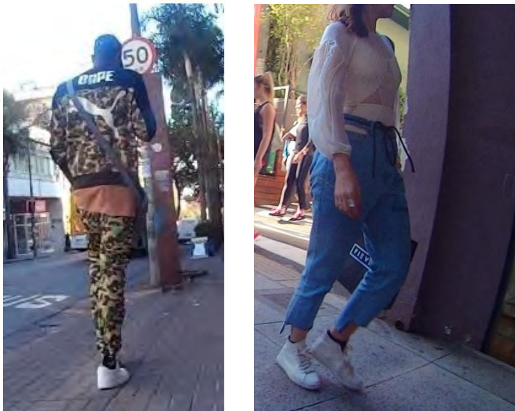
FIGURA 6 – O TIPO BRICOLEUR