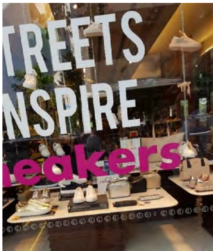
FIGURA 3 – O TÊNIS BRANCO NAS VITRINAS DA RUA OSCAR FREIRE

Além de frequentemente desfilado, o tênis branco, sneakers em inglês, como escrito em uma das vitrinas abaixo, é comercializado pelas lojas da rua Oscar Freire. Enquanto destinadores , as lojas modalizam os destinatários por meio de procedimentos de manipulação por sedução ( ter para ser/estar na Moda ). Nesses quadriláteros, os tênis brancos são expostos para serem comercializados, encenados no jogo discursivo como objetos mágicos capazes de fazer-ser aqueles que os calçarem (CLEMENTE, 2020).