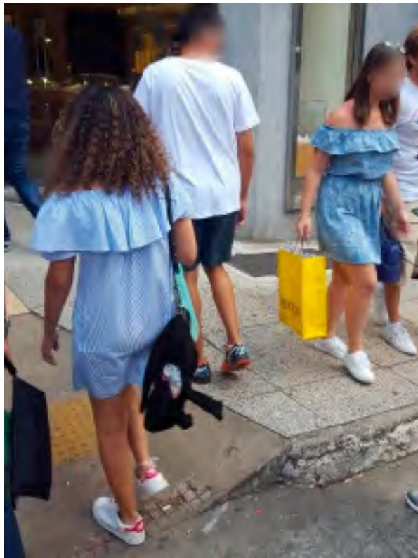
FIGURA 5 – O TIPO CONFORMISTA

FONTE: Acervo da autora, rua Oscar Freire, 2016.