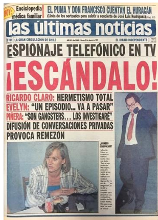
Figura 3. Portada del Diario chileno Las Últimas Noticias , del 25 de agosto de 1992 20 .

entre Piñera -por aquel entonces pre candidato a la presidencia de la república- y un colaborador en la que ambos conspiraban para sacar de carrera a su competidora Evelyn Matthei (Delgado: 2018).