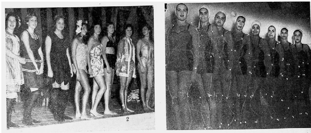
FIGURA 3 – EVOLUÇÃO DO MAILLOT