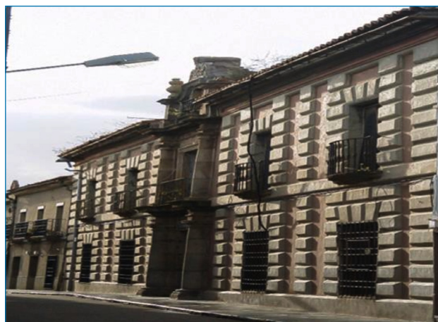
Imagen 3. Academia de Minas

El centro histórico de Almadén, desde la mina hasta la Plaza de la Constitución junto con el Castillo de Retamar (siglo XI), la Casa Academia de Minas (siglo XVIII) (Imagen 3), y los edificios que rodean las minas.