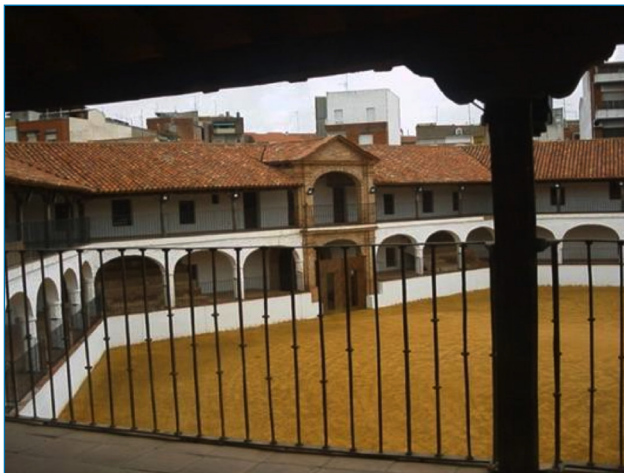
Imagen 4. Plaza de Toros

Elementos de alto valor fuera del centro histórico de la ciudad y de los límites del conjunto propuesto: Restos arqueológicos de la Real Cárcel de Forzados, el Hospital Real de Mineros de San Rafael y la Plaza de Toros (Imagen 4), todos ellos del siglo XVIII.