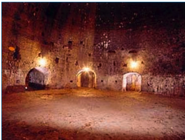
Imagen 5. Baritel de San Andrés