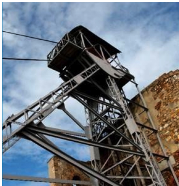
Imagen 2. Pozo de San Aquilino

Española. Data de la segunda mitad del siglo XVI cuando el proceso de amalgamación del mercurio hizo posible la explotación a gran escala de los metales preciosos de la América Hispana. Europa y América estaban estrechamente unidas en una estructura que unía puertos y ciudades a través de España y Portugal. Los pueblos y los nodos de comunicación aseguraban la estabilidad de los monopolios comerciales y otros valores culturales y espirituales, el cual ha perdurado hasta el día de hoy.