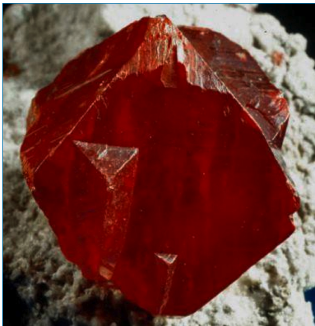
Imagen 1. Cristal de cinabrio