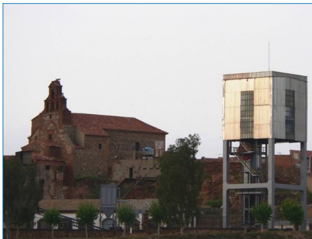
Imagen 10. Pozo de San Teodoro e iglesia de San Sebastián