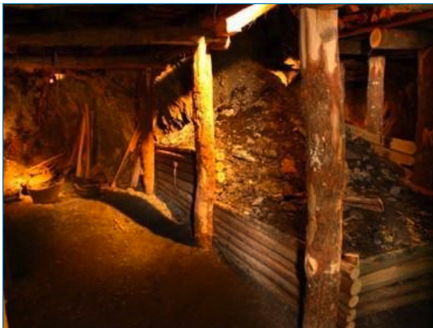
Imagen 8. Método de explotación minera por hurtos