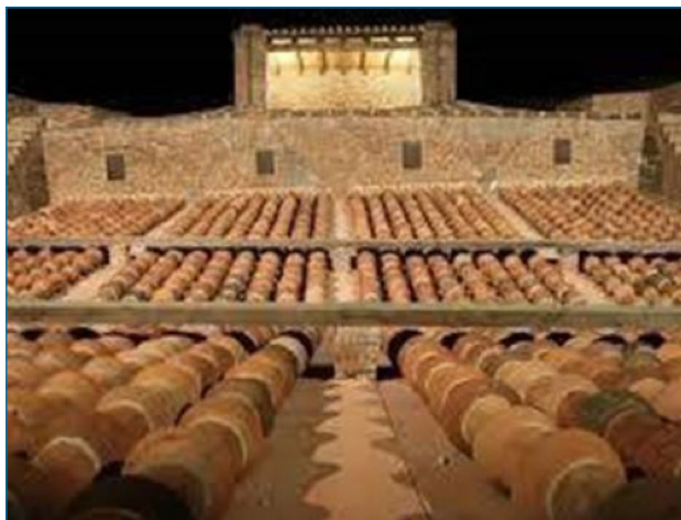
Imagen 6. Horno de aludeles

y, en general, a la ejecución de obras y también a la planificación (Imágenes 5 y 6).