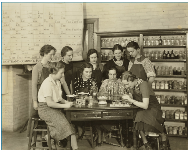
Figura 1. Imagen de mujeres junto a una tabla periódica trabajando en un laboratorio de Filadelfia en 1937.

Proyectos recientes como el titulado Women in their Element han buscado superar estos vacíos historiográficos y recuperar las contribuciones científicas de diferentes científicas no sólo con el objetivo de visibilizar sus contribuciones a la tabla periódica sino también de estudiar las razones por las que han quedado ocultas a lo largo del tiempo. [11] Diferentes trabajos de historia de la química –y de otras disciplinas– han mostrado como existen muchos casos de desigualdades en parejas científicas en las que se han producido apropiaciones intelectuales. Algunas de estas desigualdades fueron resultado de la colaboración científica entre parejas sentimentales que trabajaban en el mismo laboratorio. El conocido modelo de “marido-profesor/esposa-asistente” muestra cómo muchos de los triunfos y avances profesionales de muchos hombres en ciencia fueron posibles gracias a la colaboración de mujeres que les ayudaban y ejercían de asistentes, corrigiendo trabajos, organizando notas, atendiendo la correspondencia y organizando la vida social y familiar. Un ejemplo es el de la físico-química Isabella Karle (1921-2017) –de soltera Isabelle Helen Lugoski– casada con Jerome Karle (1918-2013),