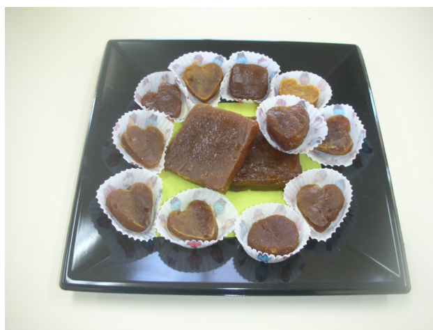
Figura 4. Dulce de melocotón: presentación final.

Melocotones recogidos el 10 de julio de 2018 con un estado de madurez aparente más avanzado, sometidos a igual proceso de selección, homogeneización y gelificación con una suspensión de citrato de calcio, que los descritos en apartados anteriores, dio lugar a un gel de mayor consistencia que pudo ser presentado en forma de tableta, apta para ser cortada sin ninguna dificultad en lonchas alargadas o cuadraditos pequeños de aproximadamente 1 cm 3 . Esto puede ser debido a la presencia, en la fruta de esta cosecha, de una cantidad más adecuada de PBM para el proceso de gelificación que pretendemos realizar. Después de un año de almacenado en el frigorífico a una temperatura de 5°C, la muestra mantiene su estado de conservación, muestra un buen sabor y conserva un claro matiz ácido debido al jugo de limón que tiene en su formulación.