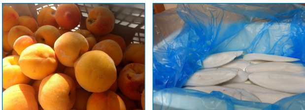
Figura 3. Melocotones maduros variedad catherina (izquierda). Caparazones calizos, jibiones o sepiones (derecha).

También el día 3 de julio de 2019, un número de 20-30 jibiones obtenidos de la limpieza de jibias recién descongela-das para su procesado, fueron suministrados por la empresa New Concisa, S. L., (Figura 3, derecha). Para facilitar su transporte y buena conservación, previamente habían sido refrigeradas e introducidas en una caja de polietileno expandido. En nuestro centro, los jibiones fueron guardados en el frigorífico a una temperatura de 5°C. Al día siguiente, se lavaron con abundante agua del grifo y se sometieron a cocción durante 15 minutos para reducir el olor característico de este tipo de residuo. Estos jibiones son un residuo habitual en la empresa New Concisa, S. L. por lo que se hace necesario gestionar su eliminación, a través de una empresa especializada con el consiguiente