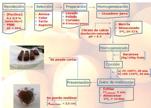
Esquema 1. Diagrama de flujo del dulce de melocotón.

sible corregir la formulación inicial añadiendo un volumen adicional de suspensión o disolución saturada de citrato de calcio y calentando a 100°C durante períodos de 20 minutos hasta alcanzar el grado de consistencia deseado.