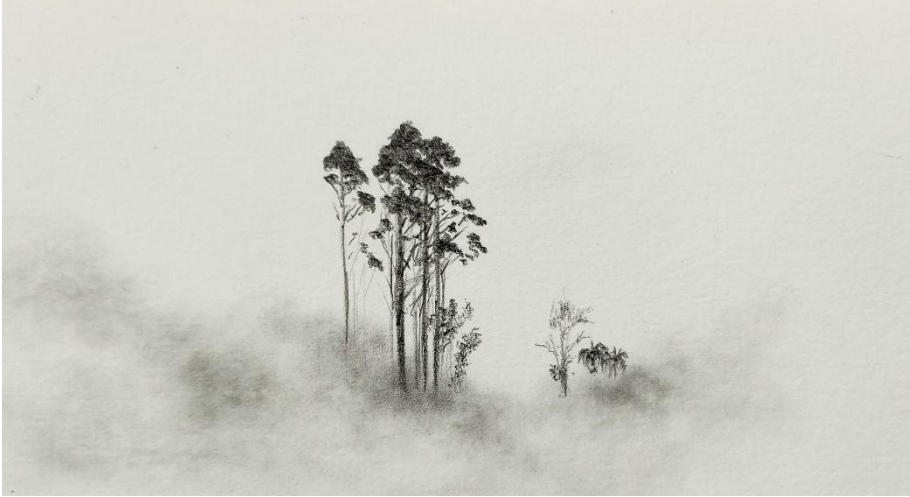
Josué Pavel Artista visual Contemplación y Salto, 2020 Grafite em Papel. 10.5 x 18.5 cm