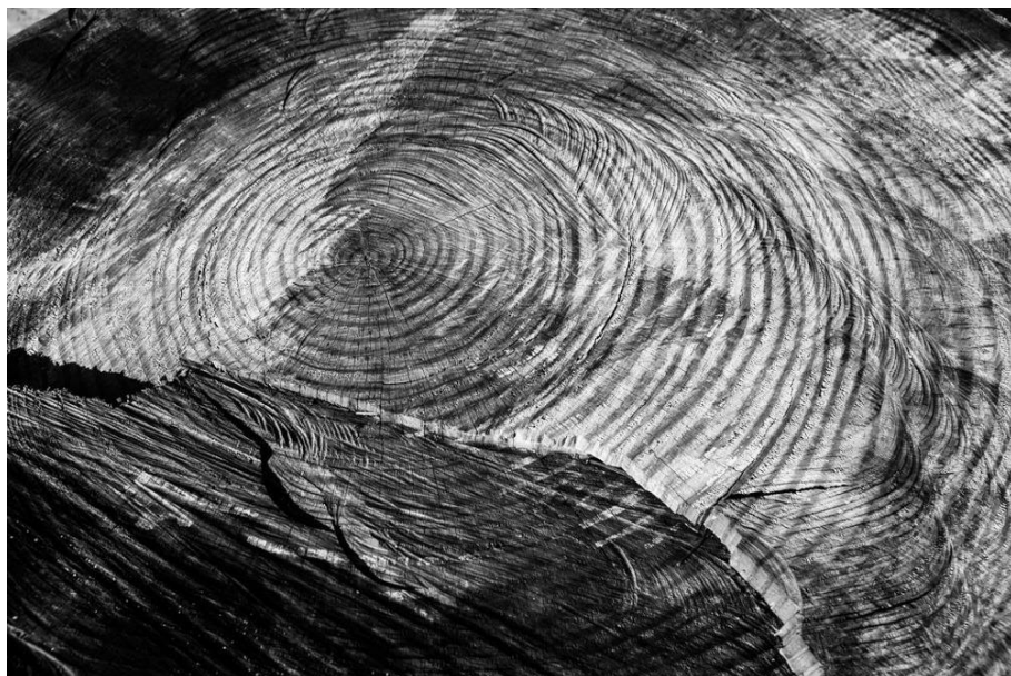
Heloïse Faure Fotógrafa