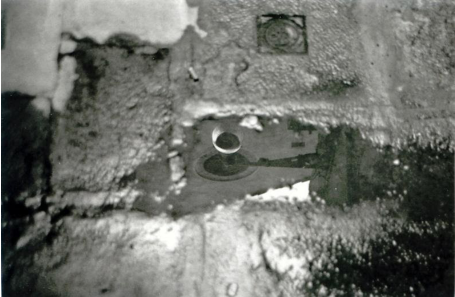
Alejandro H. Mestre Poeta y Escapista da série Reflejos venecianos, 2002 digitalização de foto analógica