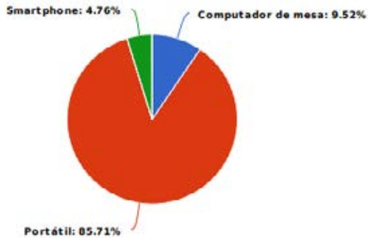
Grafica 3: Accesorios tecnológicos utilizados para el desarrollo de un curso.

Como se muestra en la gráfica 3. El dispositivo más usado para realizar un MOOC con un 86% es el computador portátil, y en un 5% con Smartphone, ya que se manifiesta que no todas las plataformas cuentan con aplicativo móvil y es más complejo su uso.