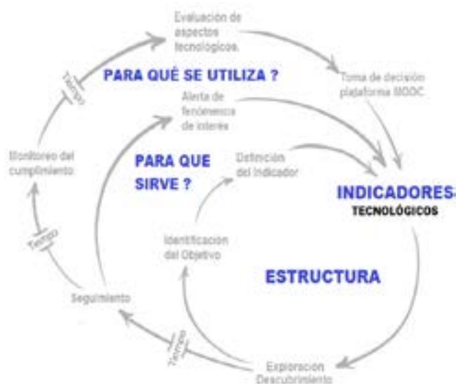
Figura 1: Funcionalidad del indicador de un MOOC, modificado y adaptado de la imagen tomada de https://cabreramc.files.wordpress.com/2015/04/marco_transformaciocc81n_ff.jpg

3 Se utilizó la inscripción a la versión gratuita.