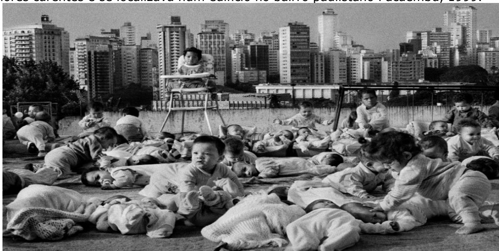
Imagem 5: Foto da Fundação Estadual do Bem-Estar do Menor (FEBEM) na época em que cuidava de menores carentes e se localizava num edifício no bairro paulistano Pacaembu, 1999.