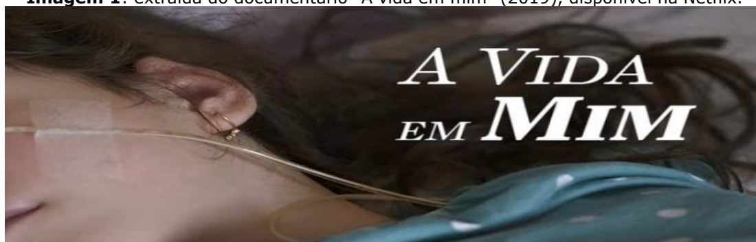
Imagem 1: extraída do documentário "A vida em mim" (2019), disponível na Netflix.