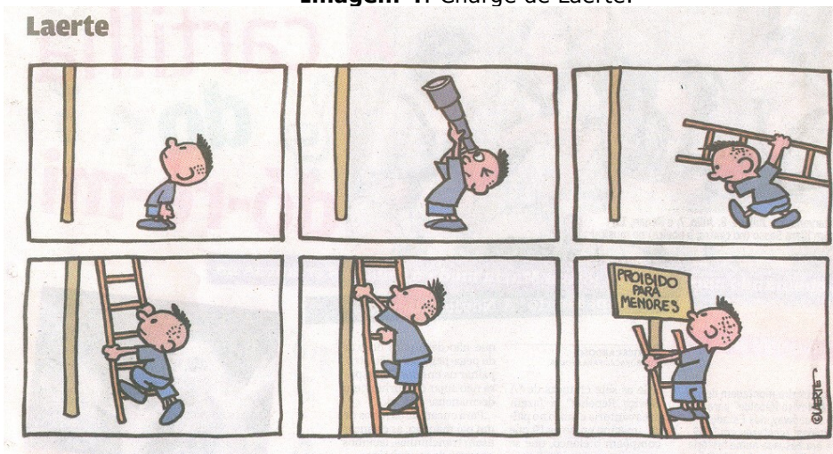
Imagem 4: Charge de Laerte.

Na imagem abaixo também evidenciamos a problemática da infância na interlocução com o adultocêntrismo que limita e restringe a participação social das crianças como sujeitos de direitos.