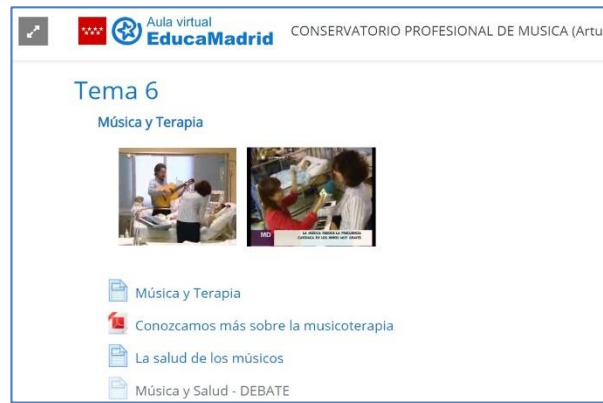
Figura 1: Aula virtual del curso “La música en el mundo profesional” ( https://aulavirtual34.educa.madrid.org/cpm.ciudadlineal.madrid/course/view.php?id=52 )